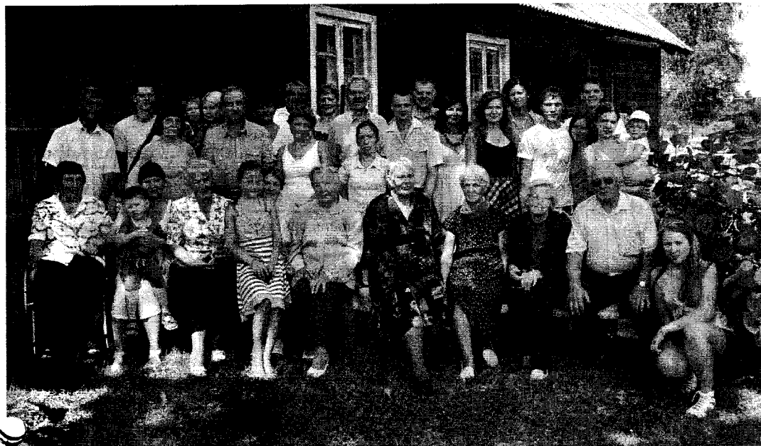
Putniņu dzimtas atvases Kalna Silenos

Pirms vienpadsmit gadiem pašā vasaras briedumā 24. jūlijā Putniņu dzimtas māja Madlienas pagasta Vilkos sagaidīja savējos. Arī šogad 24. jūlijā Putniņi salidoja atkal. Tikai šoreiz Kalna