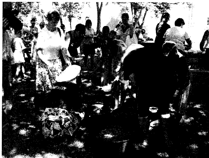
Visiem tikai karotes

Esiet mīļi sveicināti, mūsu pagasta avīzītes lasītāji!