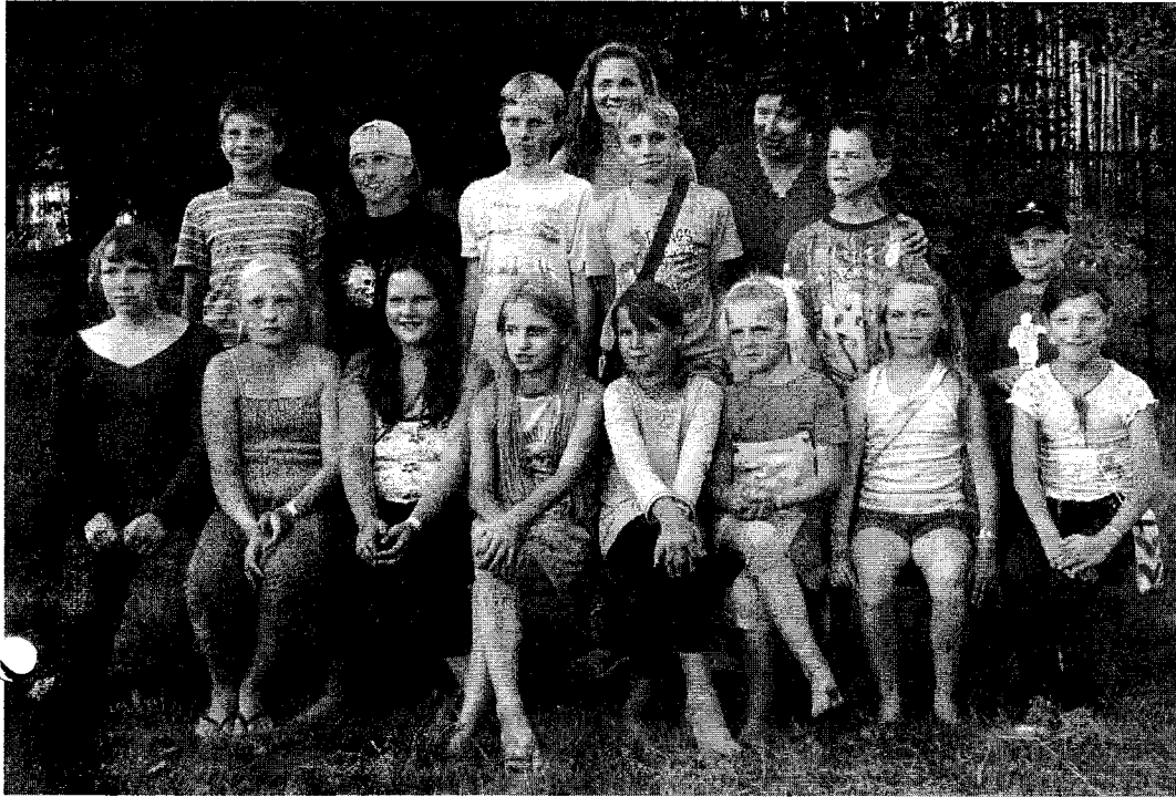
Madlienas bērni nometnē

Ir vasara. Un ikgadējā Latvijas svētdienas skolu sadraudzības nometne atkal notika Ķesterciemā, skaistā nometņu vietā pie jūras. Jūras, kuras krastos no rītiem bērni piedalījās rīta vingrošanā, jūra, kurā baudīt veldzi no vasaras karstuma, jūra, pie kuras bērni mācījās par Dievu, spēlējās, dziedāja par godu Jēzum, ieguva jaunus draugus un lieliski atpūtās. Nometne, kas veldzēja bērnus gan fiziski, gan garīgi.