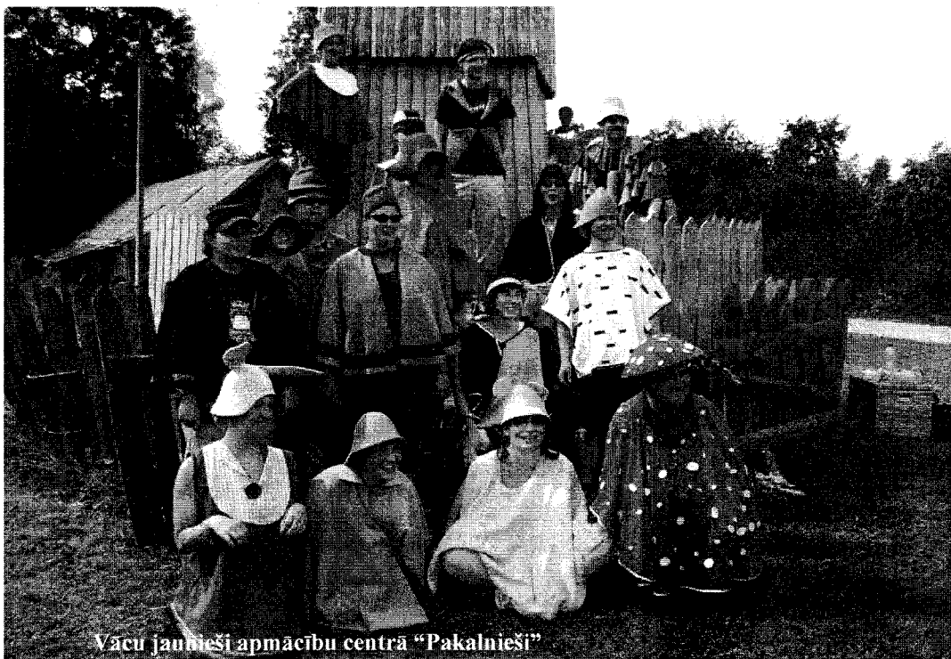
Vacu jaunieši apmācību centrā „Pakalnieši”

No 29.VII – 5. VIII Madlienas draudze atkal uzņēma vacu jauniesus, lai kopīgi iepazītu Dievu, apskatītu skaistākās Latvijas vietas, kopīgi darbotos, atpūstos. Nometnes moto bija: „Celies un ej!”