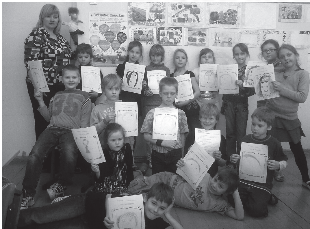
Zīmējam kopā ar Džimbu

Uz šo jautājumu jums, iespējams, varēs atbildēt VPIL „Taurenītis” piecgadīgo un sešgadīgo bērnu grupiņu audzēkņi, kā arī Madlienas vidusskolas 1. un 2. klašu skolēni, jo viņiem šajā mācību gadā no februāra līdz maijam bija iespēja iepazīties ar Džimbu projekta „Dod „5” drošībai!” ietvaros. Ogres Attīstības Biedrība sadarbībā ar nodibinājumu „Centrs Dardedze” un ar Latvijas Šveices sadarbības grantu shēmas „NVO fonds” finansiālu atbalstu un Ogres novada pašvaldības finansiālu atbalstu Ogres novada 9 pagastos realizē šo projektu. „Džimbas drošības programma” ir preventīvi izglītojoša, interaktīva programma, kas bērniem māca personisko drošību saskarsmē ar citiem cilvēkiem – svešiem un pazīstamiem, lieliem un maziem. Džimbas drošības programmā tiek izmantotas interaktīvās metodes – mūzika, ritmiskas frāzes, video, Džimbas tēls, lomu spēles, stāsti un diskusijas, kuru laikā bērni drošības zināšanas un iemaņas pārnes uz savu reālo dzīves situāciju.