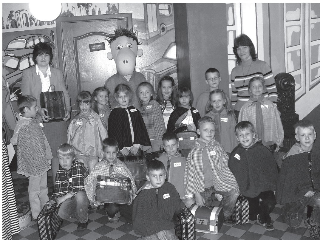
Pie Džimbas Rīgā

Vai jūsu bērns zina, kā rīkoties situācijā, ja kāds svešinieks lūdz viņam doties līdzi? Vai jūsu bērns māc atšķirt labos pieskārienus no sliktajiem un slepenajiem? Vai jūsu bērns prot pateikt: „Nedari man tā, man tā nepatīk”, tad, ja kāds pārkāpj viņa ķermeņa robežas un vēlas viņam nodarīt pāri? Tie ir tikai daži no jautājumiem, uz kuriem ne vienmēr vecāki un pedagogi zina, kā bērnam saudzīgā veidā atbildēt, tāpēc VPII „Taurenītis” vecākā un sagatavošanas grupa pieteicās Džimbas drošības programmai. Šī programma tika apgūta laika posmā no 2011. gada februāra līdz maijam.