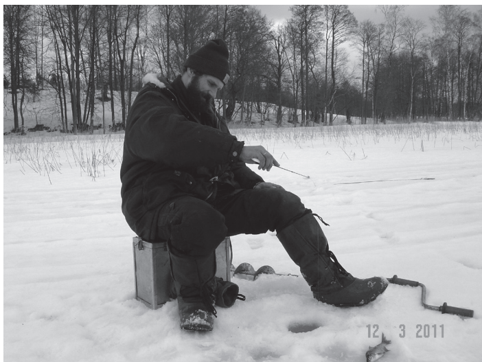
Lielo zivi gaidot

Mūsu pagasta 50 gadu jubilejas sacensības zemledus makšķerēšanā aizvadītas. Pēdējās – 3. Kārtās cīņas notika uz Pļaviņu novada Odzes ezera ledus. Uz tām skaistākajām „Mežezera” sporta un atpūtas bāzē devās 18 ziemas copes cienītāji. Vairāku gadu garumā Odzes ezerā cīnījāmies pirmo reizi. Lai dalībnieki gūtu pareizāku priekšstatu par ezera akvatoriju, izvērtētu pēc saviem ieskatiem labāko copes vietu, tiem tika izdalītas ezera kartes ar norādēm par dziļumiem, sēkliem, ličiem tajā. Jāatzīmē, ka tās tika arī izmantotas. Un nav īpaši jāuzsver, ka pareizi vai veiksmīgi izvēlēta copes vieta vienmēr dos labākos rezultātus. Šoreiz desmitniekā trāpīja divas mūsu sacensību komandas – ķeipenieši un Rīgas komanda – bijušie madlenieši.