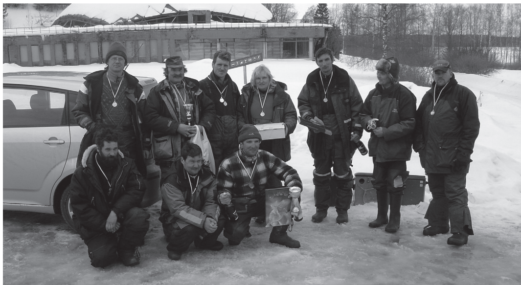
Sacensību uzvarētāju komandas