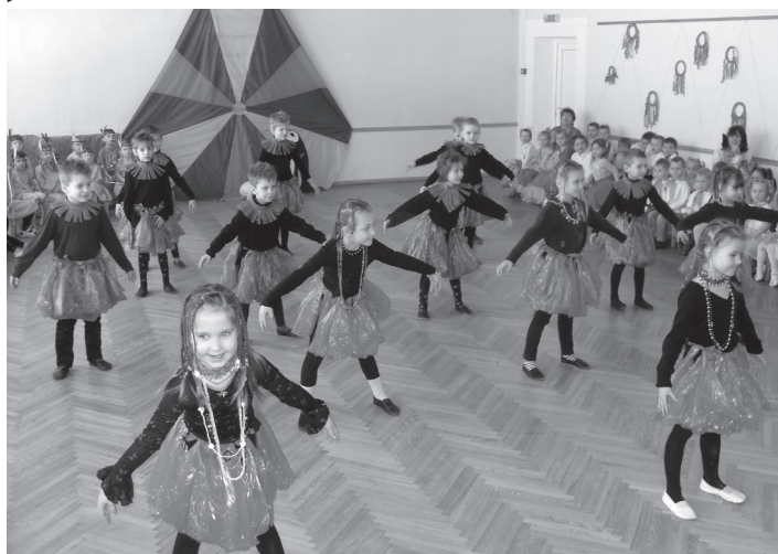
Saulespuķes grupas bērni iejutušies afrikāņu ritmos

Pēc kopīgajām sarunām, negaidīti ieradās ciemiņš no tālās Grenlandes – Pingvīns Piko / skolotāja Sarmīte Ozoliņa/, kurš