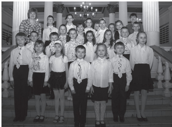
Mūzikas skolas 1.-3.klašu koris Jāzeps Vītola Mūzikas akadēmijā

2011. gada pavasarī Kārļa Kažociņa Madlienas mūzikas un mākslas skolas dzīvē norit piedaloties konkursos un aktīvā koncertdarbībā.