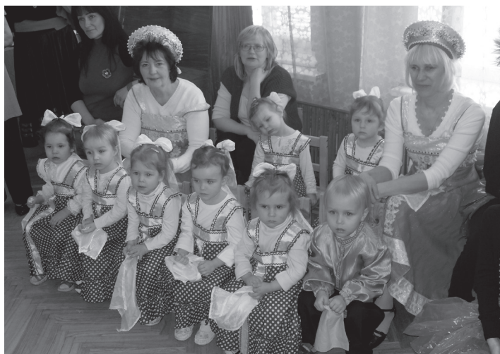
Magonītes bērni gatavi savam priekšnesumam

Ja esi nīprs un apņēmības pilns, tad nākot pavasarim, kopā ar skolotājām vari iemācīties jaunas un interesantas lietas.