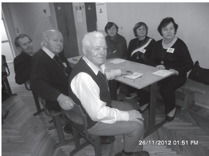
Komanda "Tikai tā"