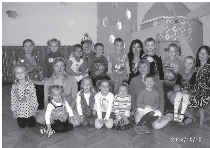
“Pīpenītes” grupa kopā ar pelēniem un gaili