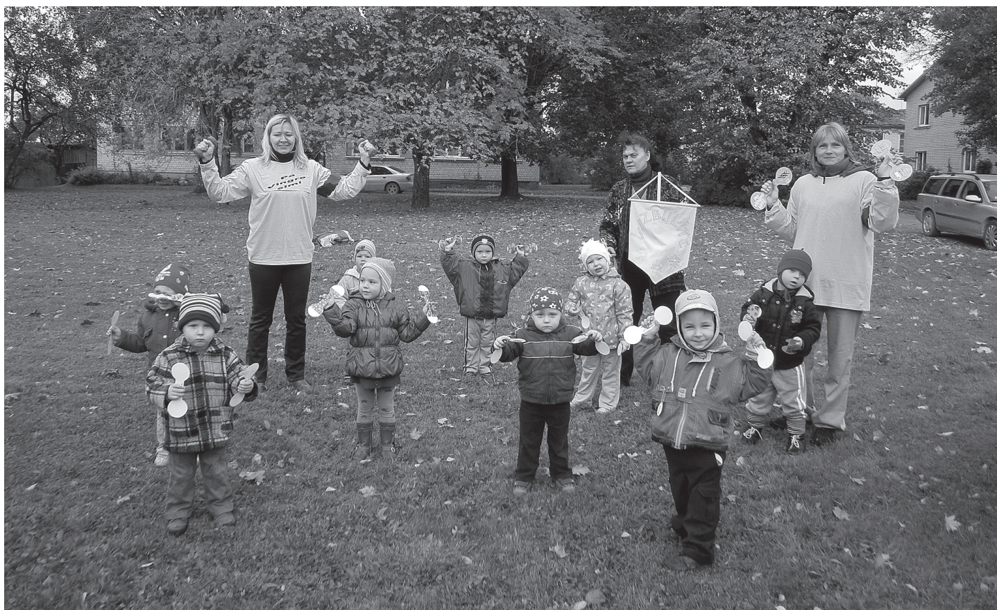
Vingro Vizbulītes grupiņas sportisti

Skolas sirdspuksti ir skolēni, Bet skolas stiprums – skolotāji. Ja skola ir lukturis, kas dāvā gaismu, Tad skolotāji ir šī luktura liesmiņa.