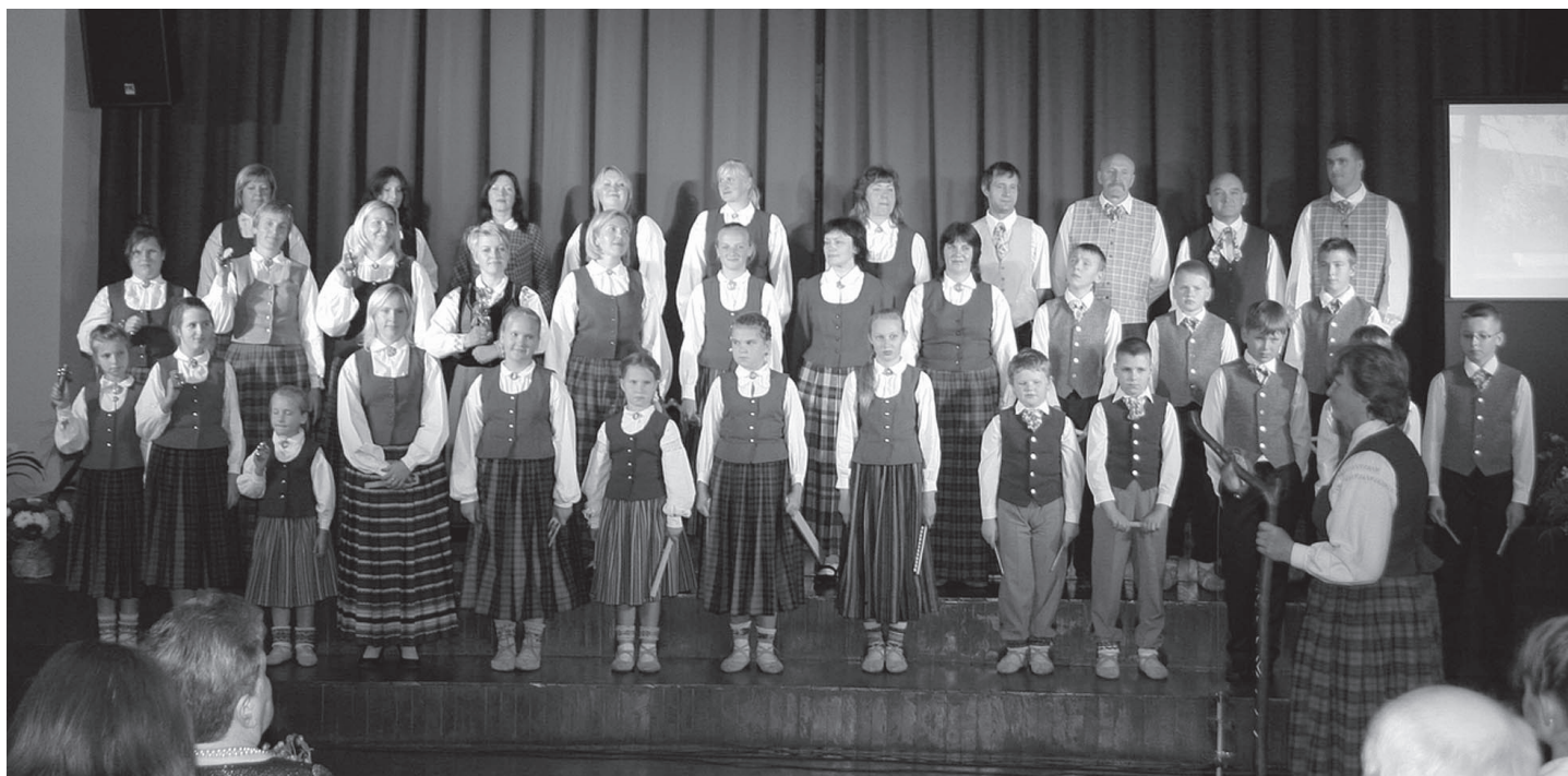
Bērnu un vecāku kopkoris