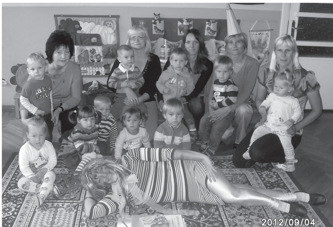
Zīmulis un Otiņa viesos pie pašiem mazākajiem