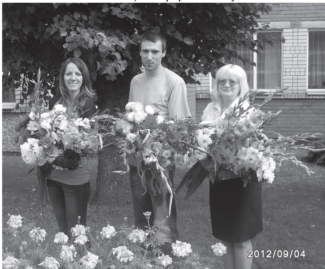
Skaistākie ziedi jaunajiem kolēģiem

1.septembris, lai arī ne oficiāli, bet pēc būtības ir vasaras beigas un rudens sākums, beigas brīvdienām bērniem, atvaļinājumiem izglītības iestāžu darbiniekiem un jauna mācību gada sākums. Tomēr nav