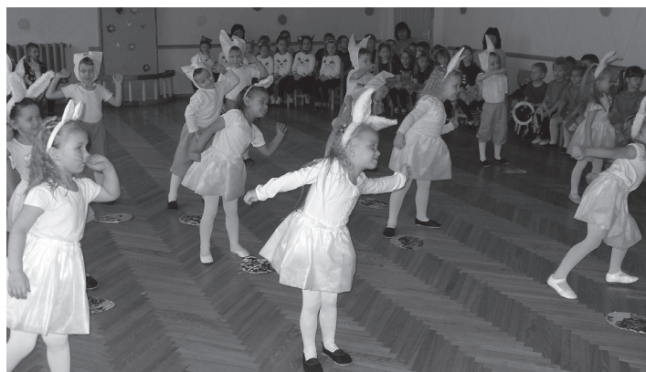
Zaķi no Pīpenītes grupas