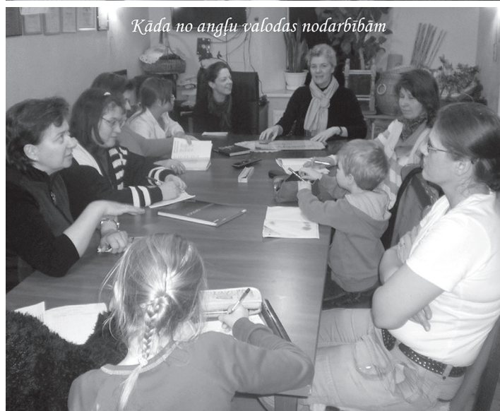
Kāda no angļu valodas nodarbībām