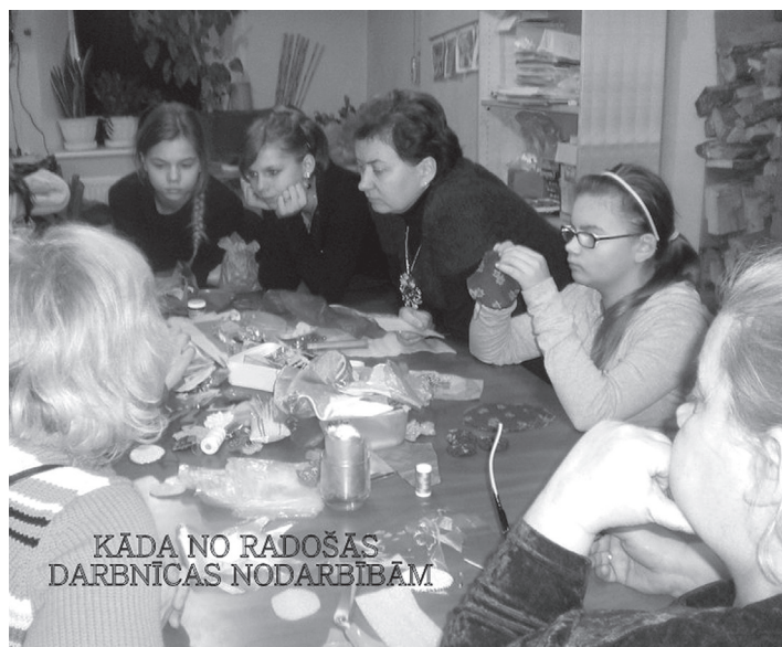
KĀDA NO RADOŠAS DARBNĪCAS NODARBĪBĀM