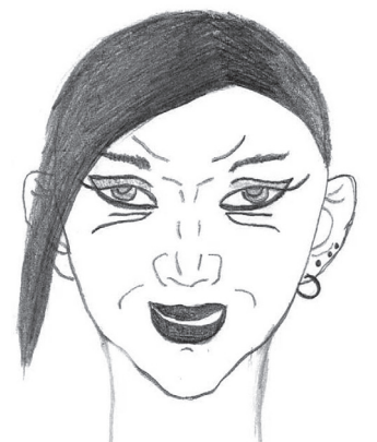
Signes Volkopas zīmējums