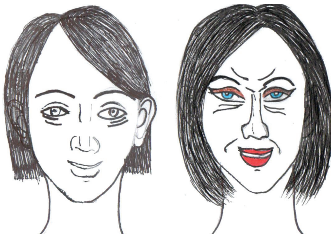
Lāsmas Pavilaite zīmējums