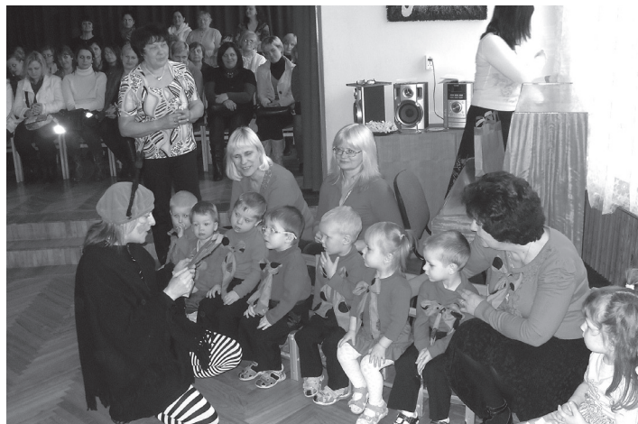
Vabolīte kopā ar Magonītes grupas bērniem