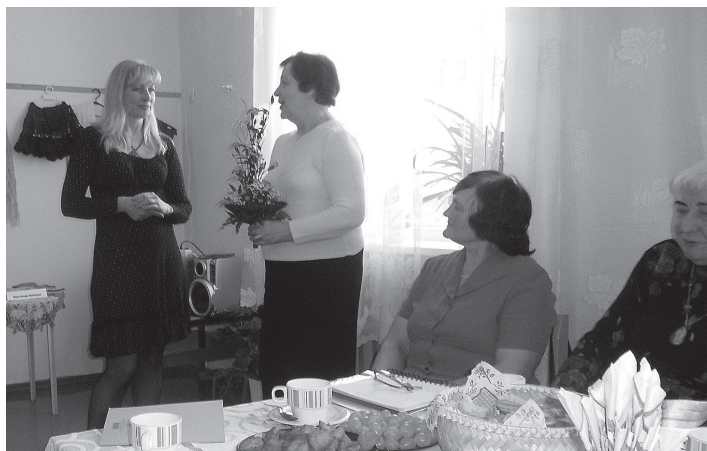
Paldies Inesei Neretai

Pensionāru biedrības „Sisegale” biedri 2. martā sanāca kopā, lai atskatītos uz 2011. gadā paveikto. Tā kā biedrības mērķis ir saturīga un interesanta brīvā laika pavadīšana senioru vecuma pagasta iedzīvotājiem, tad pasākumi bijuši vēltīti izklaidei, daži arī prāta asināšanai.