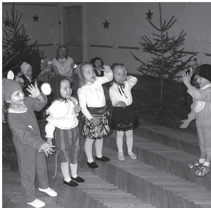
Uzvedumā „Kukulītis” Pīpenītes grupas bērni