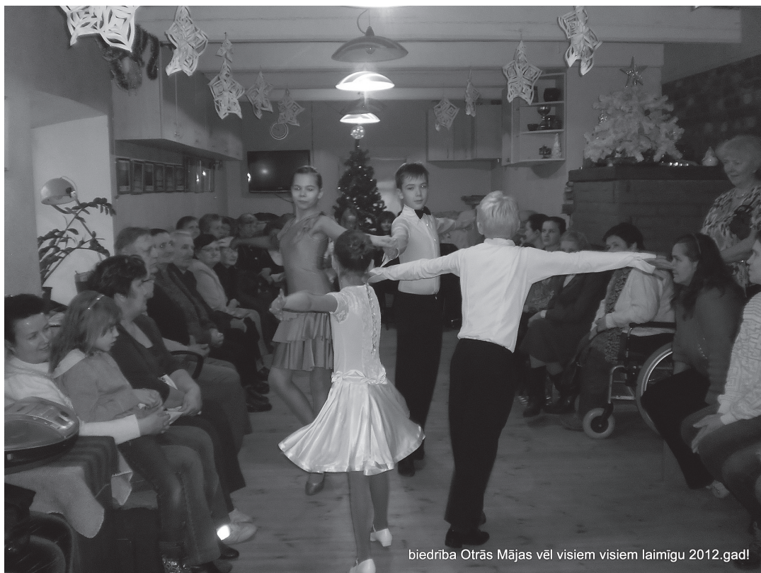
biedrība Otrās Mājas vēl visiem visiem laimīgu 2012.gad!