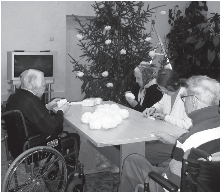
Top eglītes rotājumi