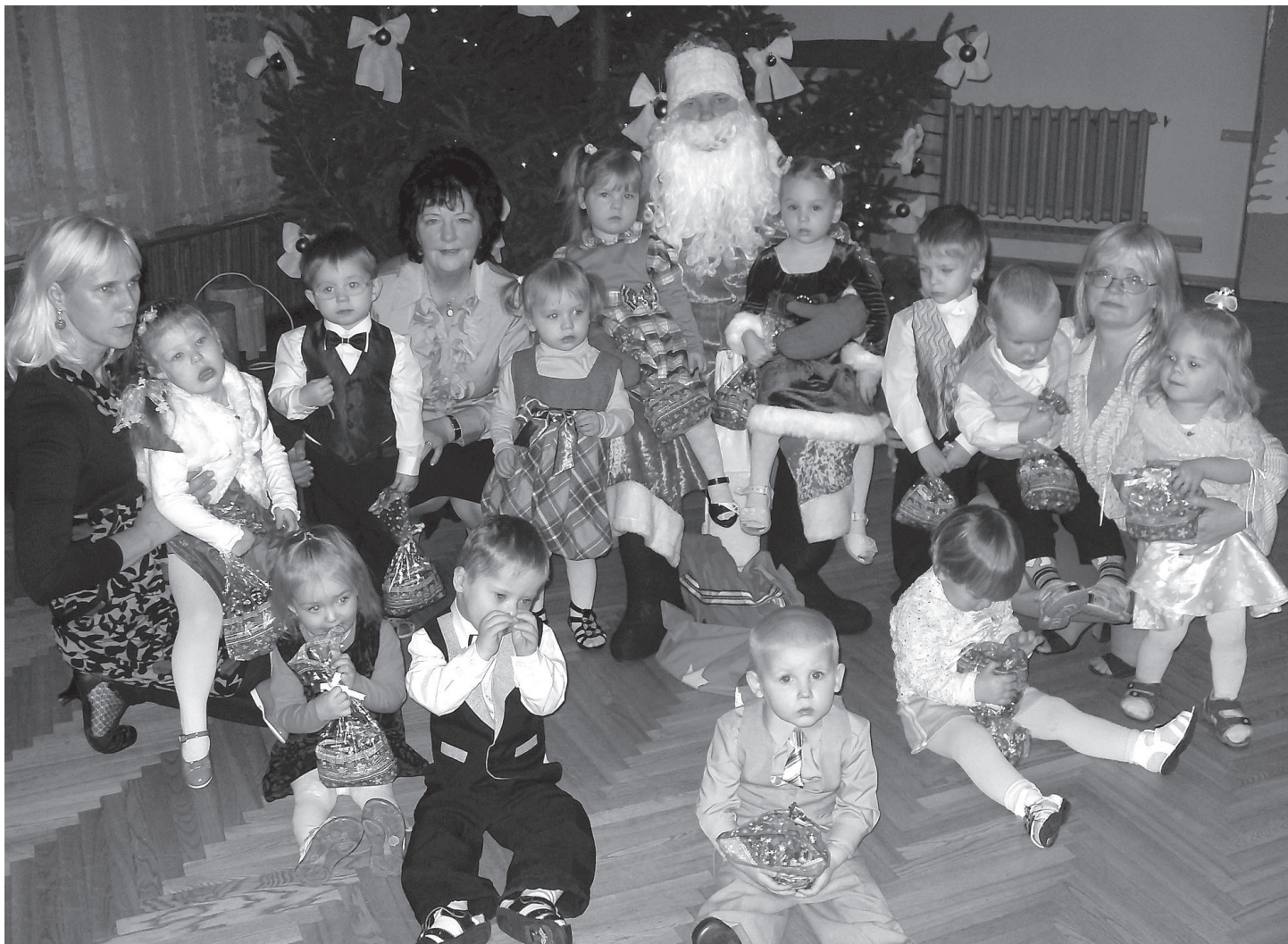
Magonītes grupas bērni kopā ar Ziemassvētku vecīti