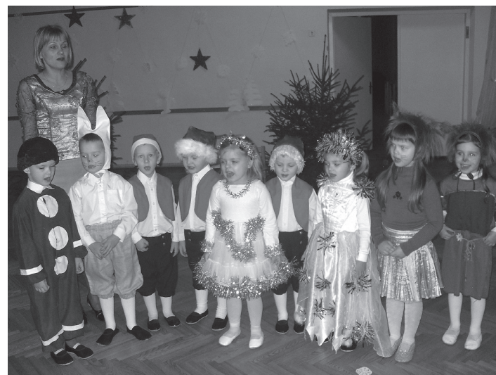
Skandējot dziesmu Ziemassvētku vecītim Vizbulītes grupas bērnu izpildījumā