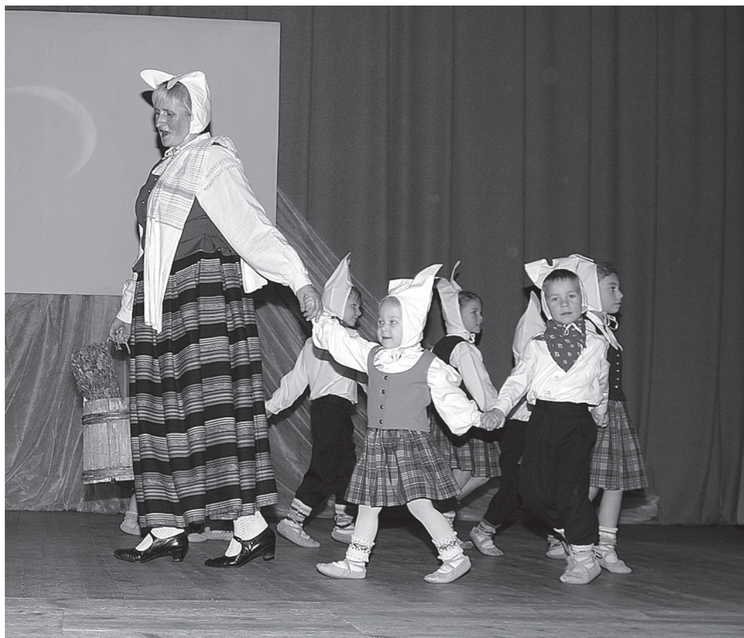
Dejo zaķēni no "Lienītes"

Vai tad patiešām tā nav? Ziemassvētki ar mums dara brīnumainas pārvērtības. Šajā laikā mēs viens otru uzlūkojam pavisam ar citādu skatienu. Mūsu attieksme pret līdzcilvēkiem ir daudz saprotošāka un iejūtīgāka, jo uz brīdi tiek aizmirstas un vairs nešķiet svarīgas citu cilvēku nodarītās pārestības. Mēs vairāk sākam aizdomāties par Dieva klātbūtni mūsu dzīvē un sajūtam viņu sirdī. Dzīves skrējieni uz mirkli kļūst nesteidzīgāki, kas ļauj ieklausīties un apzināties, ka Dievs ir un, ar viņa klātbūtni, mūsu dzīve var tapt citāda. Īpaši Ziemassvētku laikā, mums pamostas atmiņas, nojautas un rodas skaidrība par to, ko īstenībā nozīmē cilvēka dzīve un kas ir tās īstā vērtība un mērķis. Tas ir Ziemassvētku jautājums mums visiem.