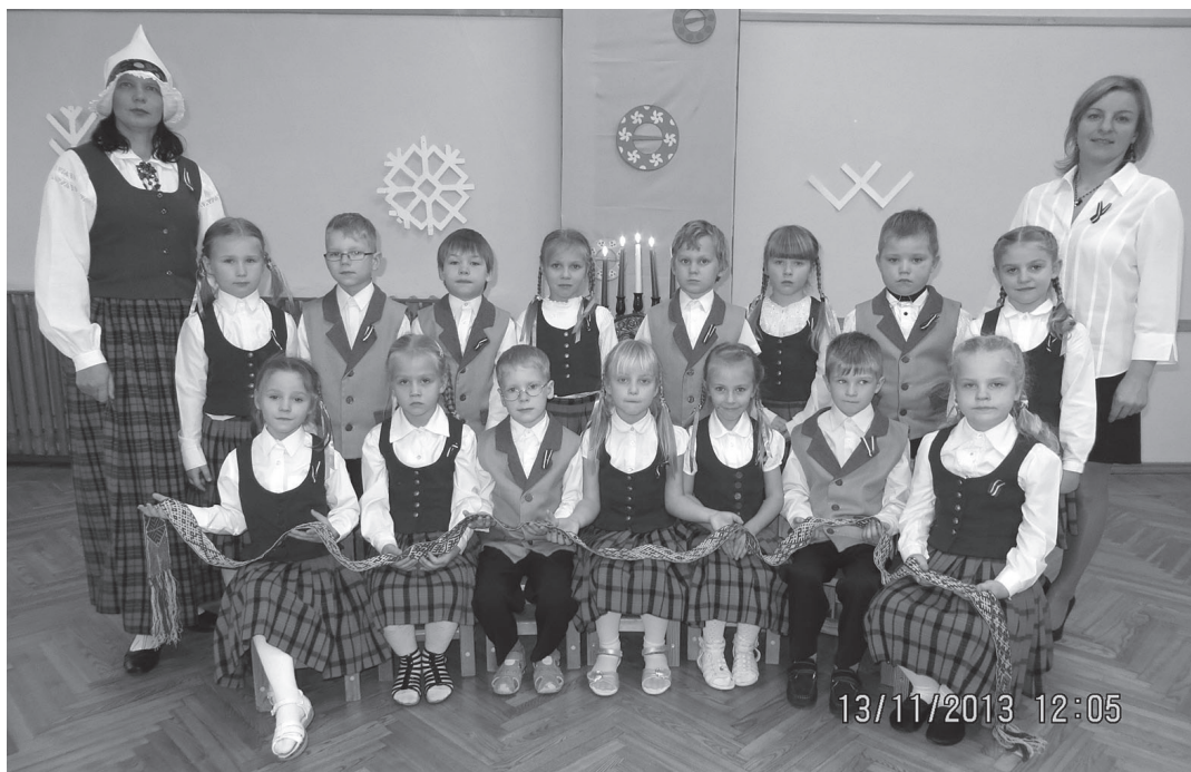
“Pīpenītes” grupa Valsts svētkos

Latvijas 95 dzimšanas dienu VII „Taurenīti” atzīmējām ar pasākumu „Liela, gara tēva josta, zvaigžņu rakstiem izrakstīta...” un izstādi „Mana Latvija”. Dar-