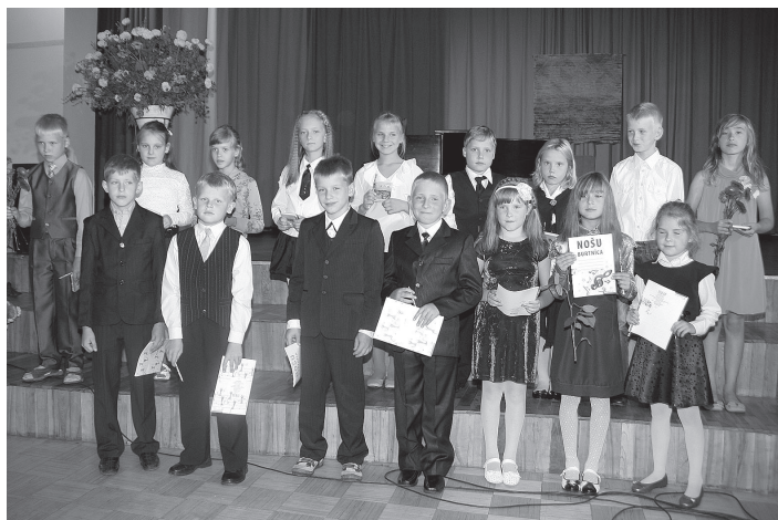
Mūzikas un mākslas skolas pirmklasnieki

2013./2014. mācību gadu profesionālās ievirzes izglītības programmās – 60 mūzikas un mākslas skola nodaļā un 50 mākslas nodaļā. Interesu izglītības program-