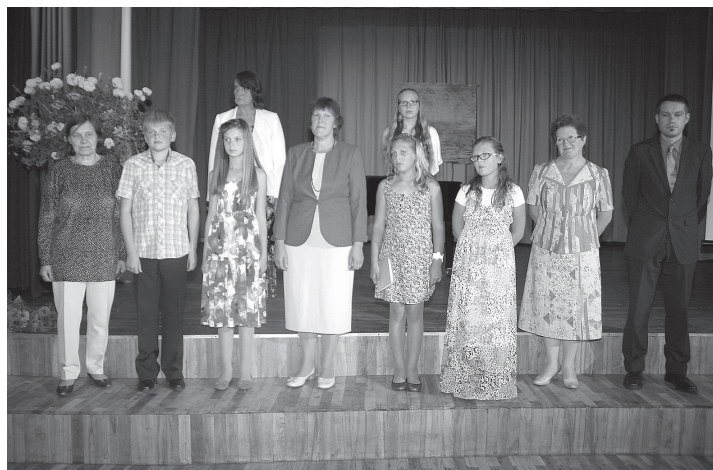
Pēc mākslas nodaļas 15 gadu jubilejas “Ceļojums mākslas pasaulē”

2013./2014. mācību gadu profesionālās ievirzes izglītības programmās – 60 mūzikas un mākslas skola nodaļā un 50 mākslas nodaļā. Interesu izglītības program-