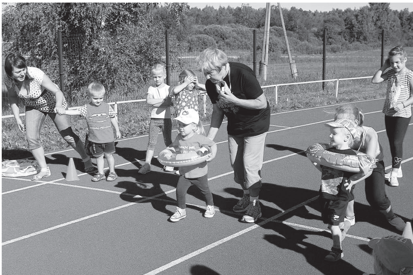
Uz starta mazākie svētku dalībnieki

24.08.2013. Madlienā notika 61. Madlienas pagasta sporta svētki. Šoreiz laika apstākļi bija ļoti pateicīgi. Uz sacensībām bija ieradušies sportisti no Madlienas, Lielvārdes, Ķeipenes, Meņģeles, Suntažiem, Lēdmanes u. c. kaimiņu pagastiem. Plašu sportistu skaitu pulcēja vieglatlētika. Vieglatlētika dalījās vecuma grupās: