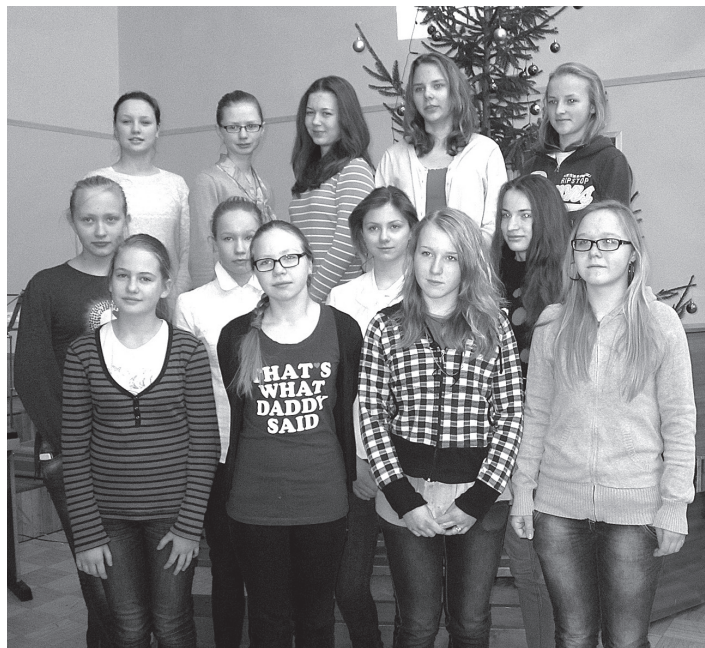
Labākie 7-9. klasēs

ir 1., 5. un 10. klases skolēni saistībā ar adaptāciju jaunā izglītības pakāpē. 1. klases skolēni labi apguvuši pirmsskolas izglītības programmu bērnu dārzā, veiksmīgi uzsākuši mācības sākumskolas posmā un apņēmības pilni ar visu lieliski tikt galā. 1.-4. klasē īpaša vērība tiek veltīta lasītprasmes pilnveidošanai, jo pareiza teksta izpratne ir pamatā pārējo mācību priekšmetu apguvē. Ne tikai skolas, bet arī ģimenes uzdevums ir gādāt, lai bērnu interese par lasīšanu un prieks lasīt nemazinātos, saglabātos un sekmētu bērna vispusīgu personības attīstību. Dažiem skolēniem 5. klasē pāreja uz mācībām „lielajā skolā” sagādāja grūtības, jo ir vājas prasmes patstāvīgi mācīties, nav vairs pagarinātās dienas grupas un vienmēr blakus skolotājas, varbūt arī vecāki nav prasījuši pietiekošu atbildību par savu pienākumu izpildi. Ir gandarījums par 6. klases skolēnu attieksmi pret mācību darbu, pozitīvo motivāciju un interesi par jaunām zināšanām, tikai kopīgi ar pedagogiem jāpadomā par angļu valodas sekmīgāku apguvi. Iepriecina arī 9. klases skolēnu pozitīvās pārmaiņas sekmju uzlabošanā. Daudz skolā tiek darīts, lai nodrošinātu pēc iespējas labvēlīgāku vidi sekmīgam