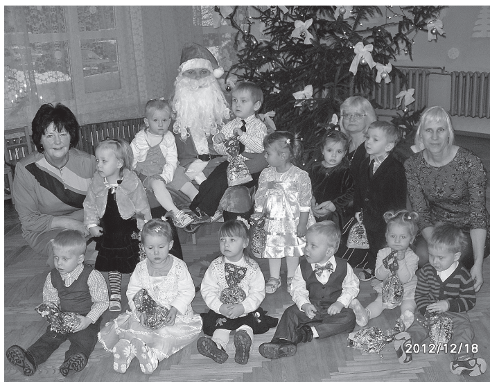
Magonītes bērni ar Ziemassvētku vecīti