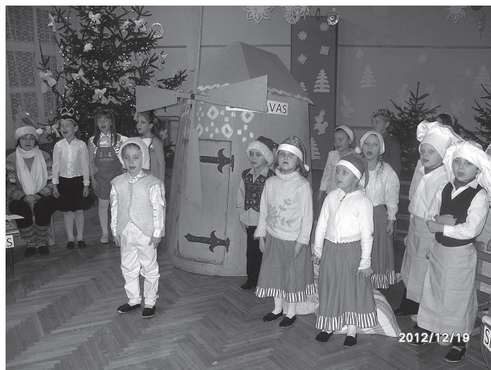
Uzvedums “Kaķīša dzirnavaņas”