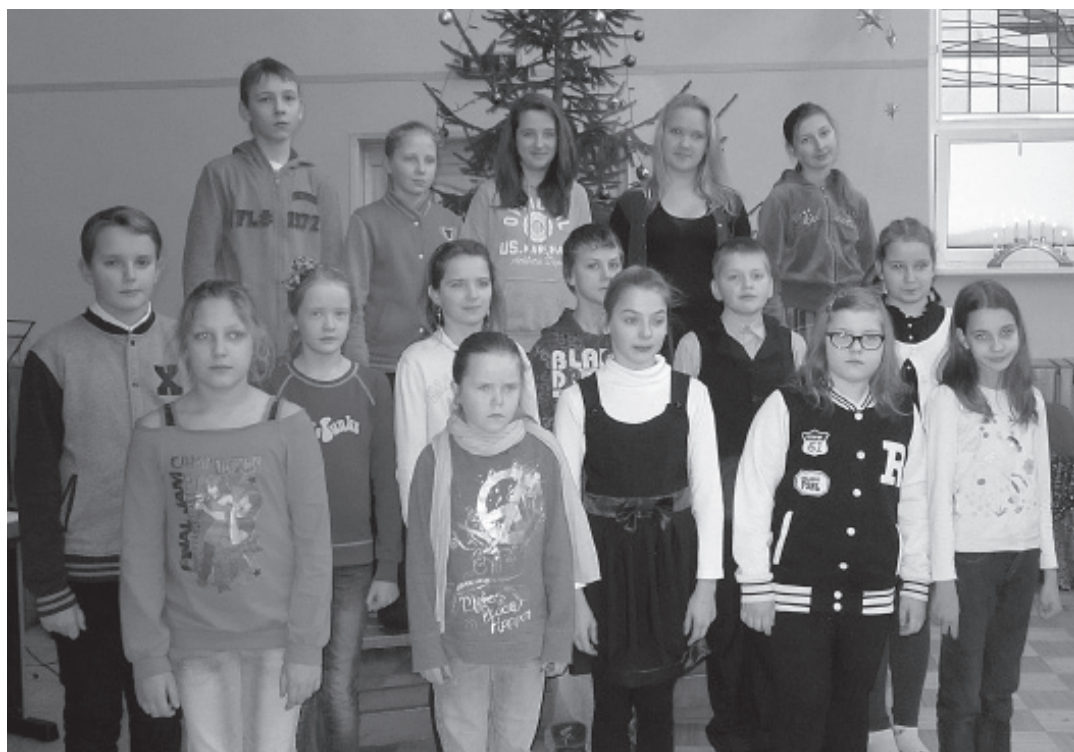
Labākie 4.-6. klasēs

ir 1., 5. un 10. klases skolēni saistībā ar adaptāciju jaunā izglītības pakāpē. 1. klases skolēni labi apguvuši pirmsskolas izglītības programmu bērnu dārzā, veiksmīgi uzsākuši mācības sākumskolas posmā un apņēmības pilni ar visu lieliski tikt galā. 1.-4. klasē īpaša vērība tiek veltīta lasītprasmes pilnveidošanai, jo pareiza teksta izpratne ir pamatā pārējo mācību priekšmetu apguvē. Ne tikai skolas, bet arī ģimenes uzdevums ir gādāt, lai bērnu interese par lasīšanu un prieks lasīt nemazinātos, saglabātos un sekmētu bērna vispusīgu personības attīstību. Dažiem skolēniem 5. klasē pāreja uz mācībām „lielajā skolā” sagādāja grūtības, jo ir vājas prasmes patstāvīgi mācīties, nav vairs pagarinātās dienas grupas un vienmēr blakus skolotājas, varbūt arī vecāki nav prasījuši pietiekošu atbildību par savu pienākumu izpildi. Ir gandarījums par 6. klases skolēnu attieksmi pret mācību darbu, pozitīvo motivāciju un interesi par jaunām zināšanām, tikai kopīgi ar pedagogiem jāpadomā par angļu valodas sekmīgāku apguvi. Iepriecina arī 9. klases skolēnu pozitīvās pārmaiņas sekmju uzlabošanā. Daudz skolā tiek darīts, lai nodrošinātu pēc iespējas labvēlīgāku vidi sekmīgam