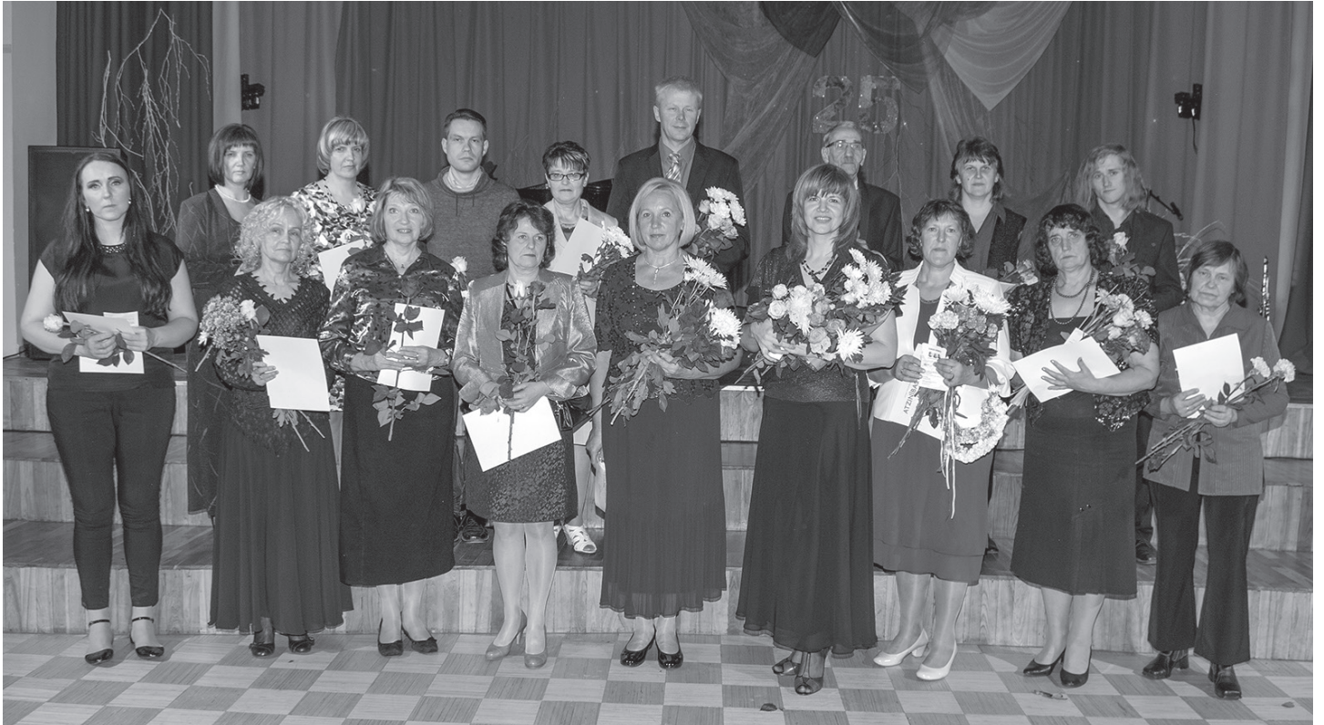
Kārļa Kažociņa Madlienas mūzikas un mākslas skolas pedagogi un darbinieki