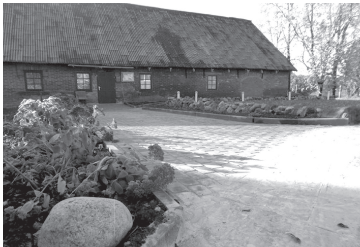
Projekts realizēts! Nāciet ciemos!

Ogres novada pašvaldības projektu konkursā „Veidojam vidi ap mums” biedrība Otrās Mājas realizēja projektu „Droši uz priekšu”. Projekta mērķis - rekreācijas un sabiedriskās zonas labiekārtošana sabiedriskā vietā. Mērķa grupa 400-500 cilvēki, kas nonākuši sociāli nelabvēlīgās situācijās.