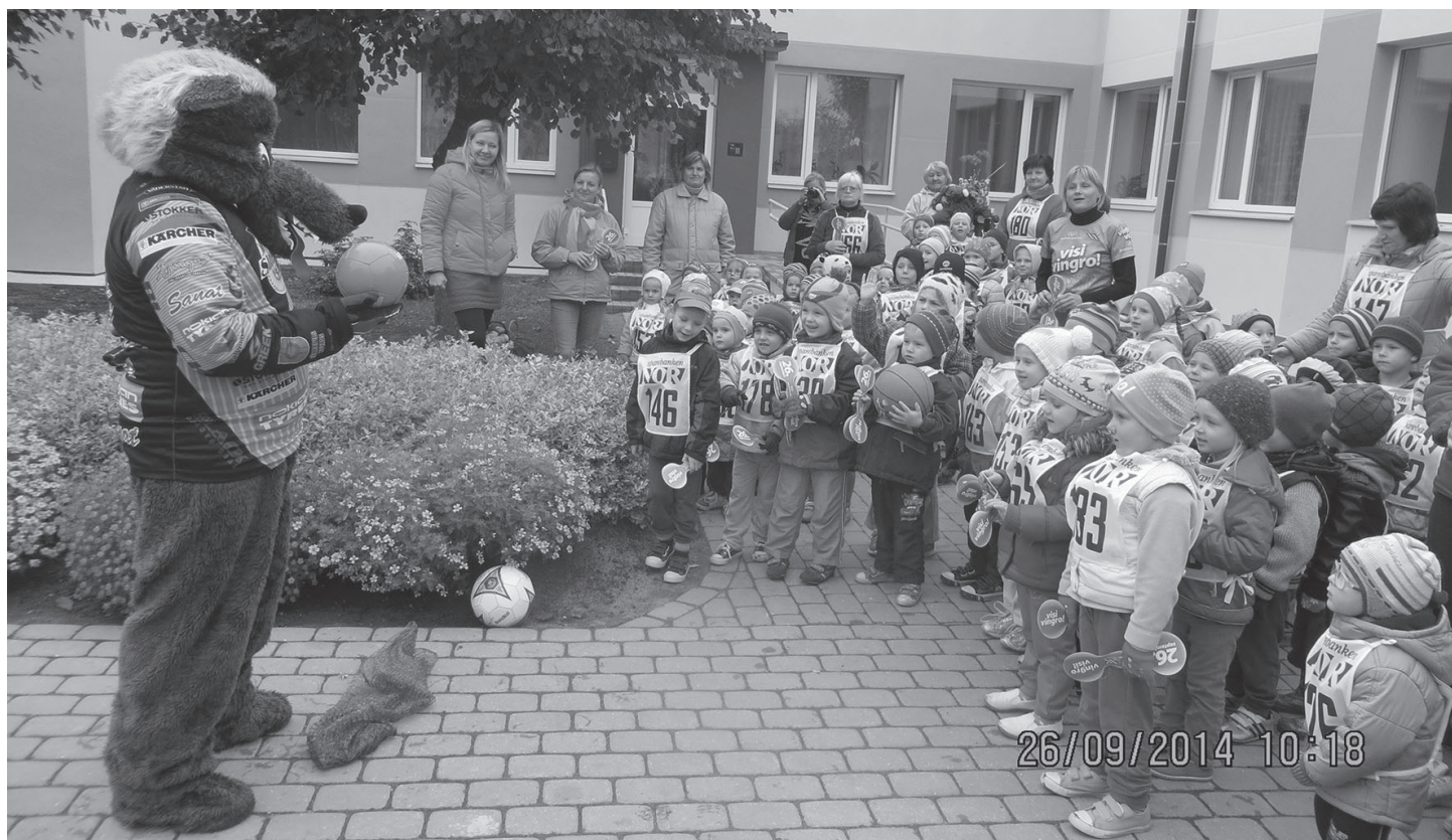
Vilks bērniem atnesis bumbas

Lai popularizētu Olimpisko kustību, veselīgu dzīves veidu, un godīgas spēles principus sportā, arī šogad 26. septembrī Latvijā notika Olimpiskā diena ar vienojošu devīzi „Iepazīstiesmini handbols.”