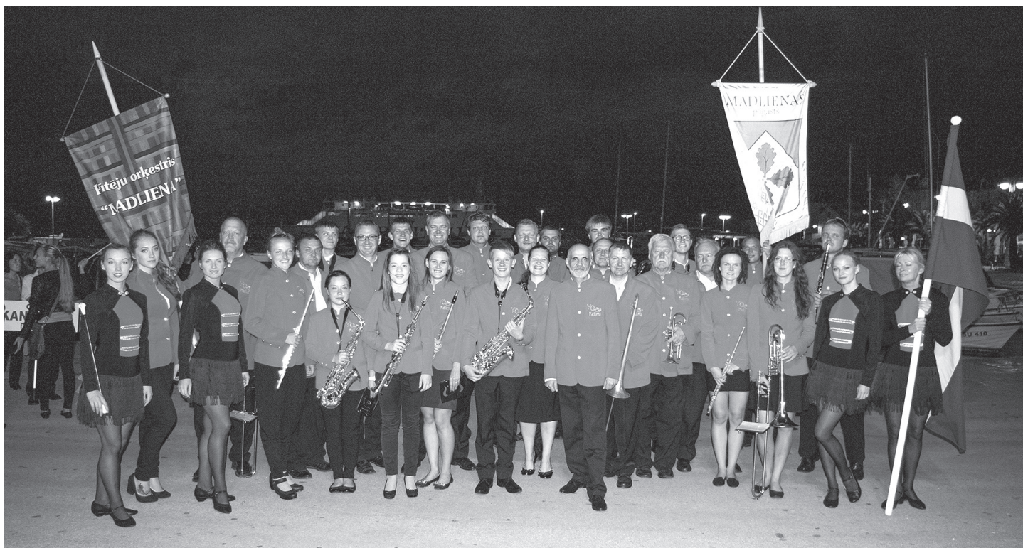
Pūtēju orķestris "Madliena" Horvātijā

Hei, hei...! Ikvienam Horvātijas brauciena autobusa pasažierim būs atpazīstami šie skanīgie dziesmas ieskaņas vārdi, kurus varētu nodēvēt par ceļojuma devīzes saukli. Tikpat skanīgām ovācijām, panākumiem, piedzīvojumiem, prieka un saules piepildītas dienas Madlienas pūtēji un mažoretas pavadīja Bračas salas mūzikas un dejas festivālā Horvātijā. Brauciena mērķis bija parādīt kolektīva spējas un ieinteresēt citu valstu orķestrus tālākai festivālu, koncertturneju un konkursu sadarbībai, nesot Madlienas vārdu pasaulē. Acīm redzami, ka pēc šāda notikumiem un emocijām piesātināta ceļojuma uz dienvidiem, enerģijas un degsmes piepildīta iesākusies Madlienas pūtēju orķestra jaunā mākslinieciskās pašdarbības sezona.