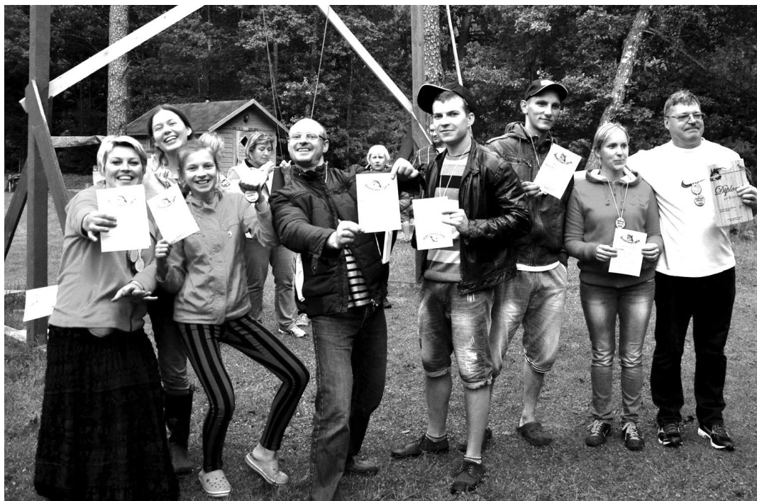
1.vietas ieguvēji - komanda MPP

summā dotu lielāko punktu skaitu. Nākamais sacensību posms „Oda acs” norisinājās paintbola trasē. Ja galvā uzmaukta liela un neērta ķivere, tad ar mazu šautenīti, kurā ielādētas mazas bumbiņas, trāpīt mērķi ir visai sarežģīti, bet ne iespējami. Atpūtušies matemātikā un paintbola trasē, ar svaigiem spēkiem dalībnieki devās uz mototrasī. Šoreiz motocikli izsniegti netika, trase bija jāveic skriešus vai uz velosipēdiem, pie tam - pilnīgi visiem komandu dalībniekiem. Viegli nebija.