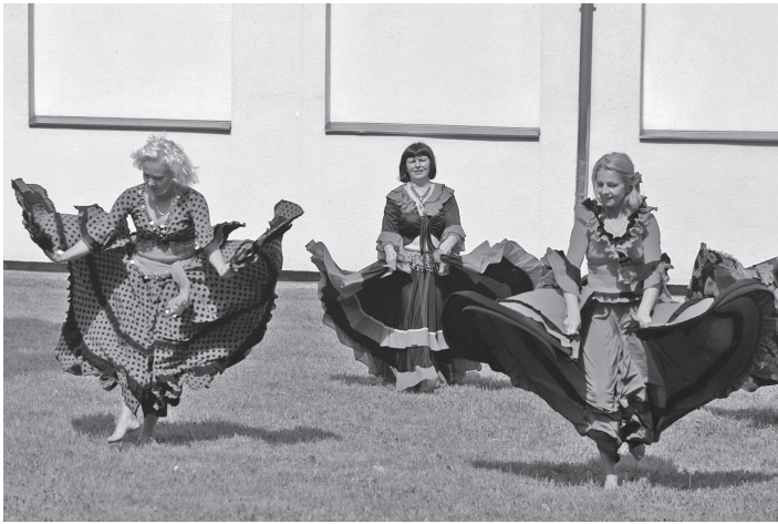
Ugunīgs deju grupas "Inda" sveiciens karstā dienā