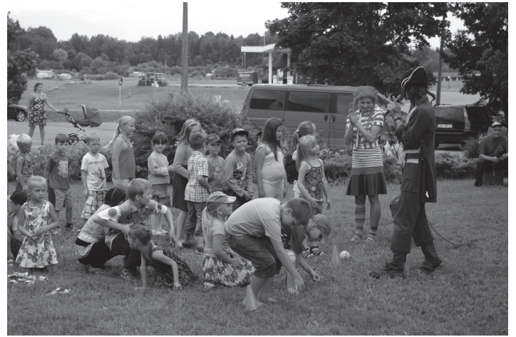
Izklaides ar Pepiju un Pirātu

bērns". Aina, kā amerikāņu filmās - kultūras nama laukums pārpildīts ar mašīnām, cilvēki sasēduši uz mašīnu motoru pārsegumiem, cits zālītē sēž mīļi apkampies, mazi un lieli - ģimenes, kopīgi skatījās iemīļoto latviešu komēdiju un klausījās patiesajā puisēnā Boņukā.