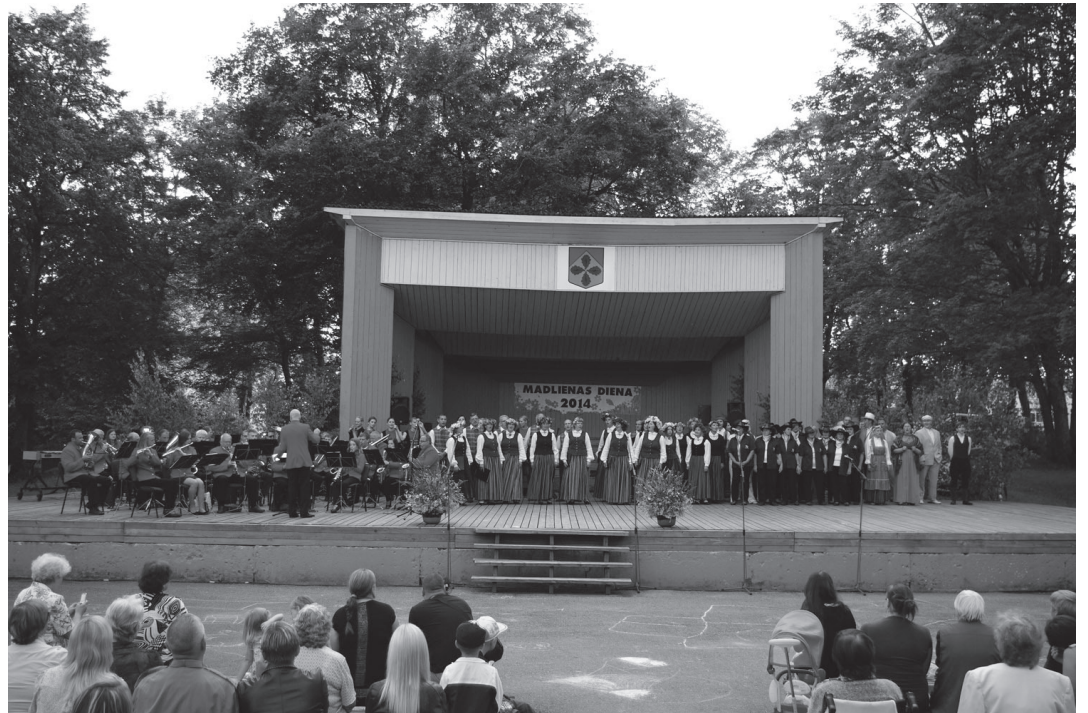
Kopā mēs esam spēks