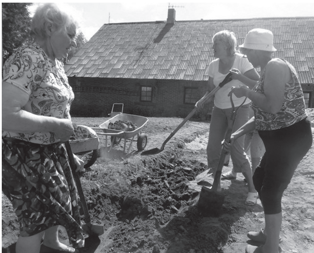
Ir katram roka jāpieliek...