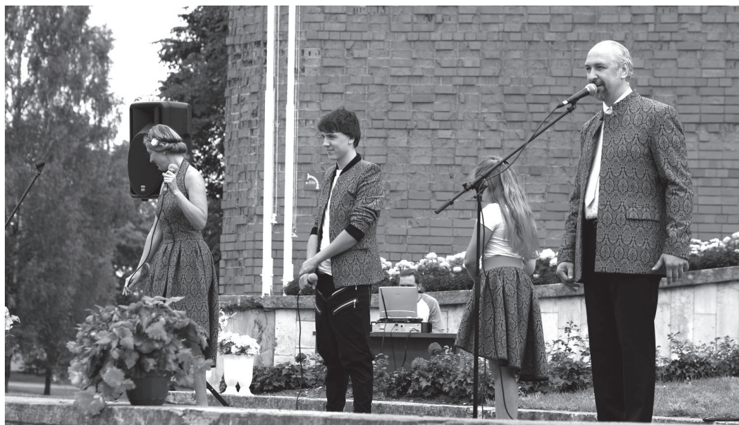
Manguļu ģimenes sveiciens Madlienai

un tā atkal kļuva par satikšanās vietu. Tālāk sekoja Madlienas iedzīvotāju un Madlienas pašdarbības kolektīvu kopīgs svētku gājiens uz estrādi pūtēju orķestra un tā pavadošās deju grupas mažorešu pavadījumā. Sākās Madlienas pašdarbības kolektīvu koncerts estrādē "Sveiciens Madlienai", kas iezīmēja šīs sezonas noslēgumu. Ar skaistu mūziku, dziesmām un dejām, ar smaidu sejā un vēlmi iepriecināt, caur savu izpausmi mākslā, Madlienas aktīvie kultūras vides veidotāji un radītāji Madlienas dienas