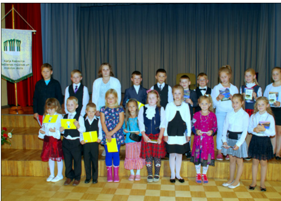
Mūzikas un mākslas skolas jaunie mākslinieki.

Klāt 1.septembris, un tas ir jaunā mācību gada sākums arī Kārļa Kažociņa Madlienas mūzikas un mākslas skolā. Nedaudz lietais un apmācies bet prieka un cerību pilns. Domas vēl kavējas smaržīgajā vasarā, tās piedziņojumos un atpūtā, bet skolotāji jau aicina uz jaunām atklāsmēm un sasniegumiem cerībā, ka bērniem būs vislabākie nodomi-kā es mācišos, kādus tik darbiņus paveikšu...Jācer, ka daža laba lielais slinkums pa vasaru būs pagaisis, un domas ļaus radoši izpausties un gūt panākumus.