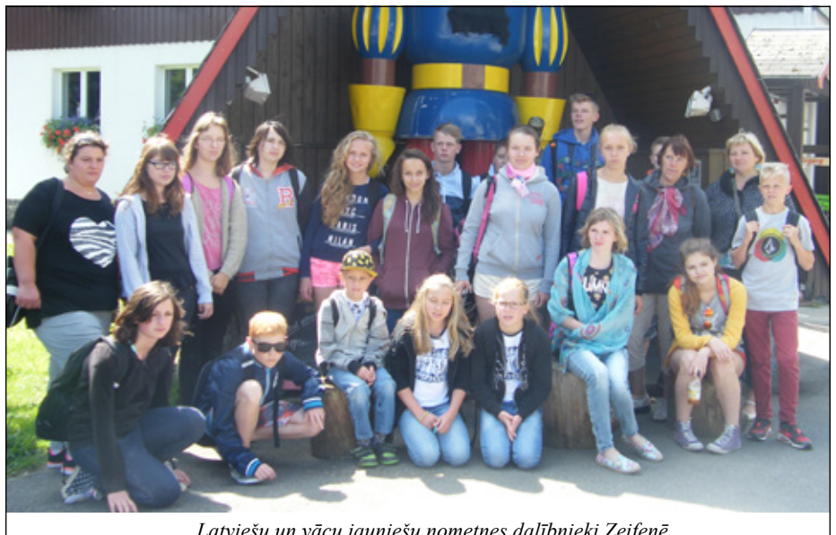
Latviešu un vācu jauniešu nometnes dalībnieki Zeifenē.