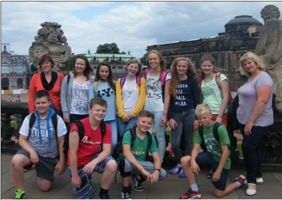
Nometnes dalībnieki pie Cvingera Drēzdenē.