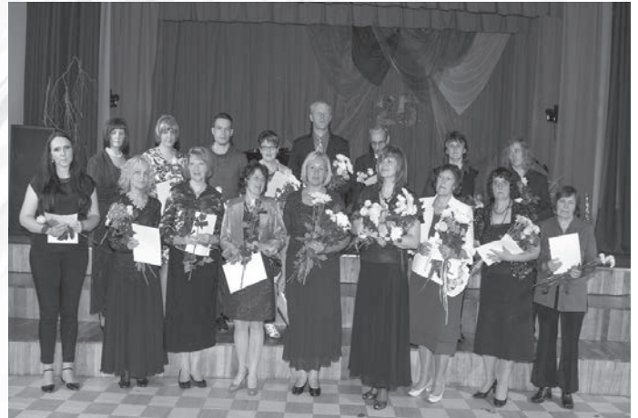
Mūzikas un mākslas skolai 25 gadu jubileja