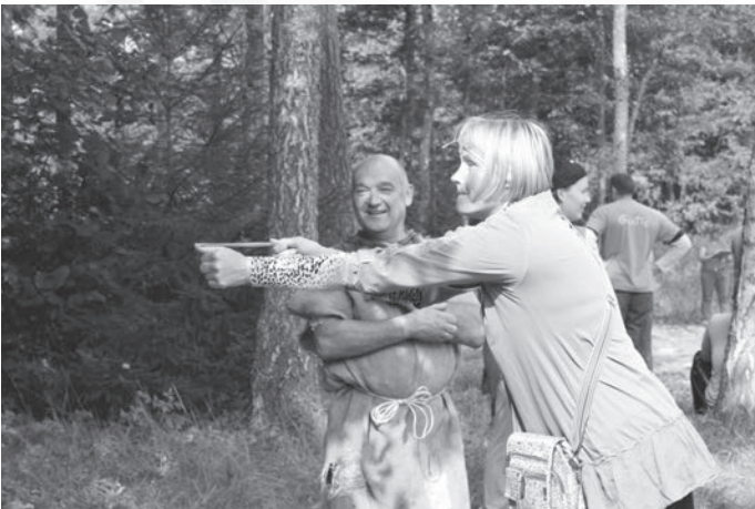
Foresta Kauss 2014 "Forsteros" - "Šaušana ar plūrkšķi"