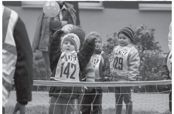
Bērnu dārzā Olimpiskā diena