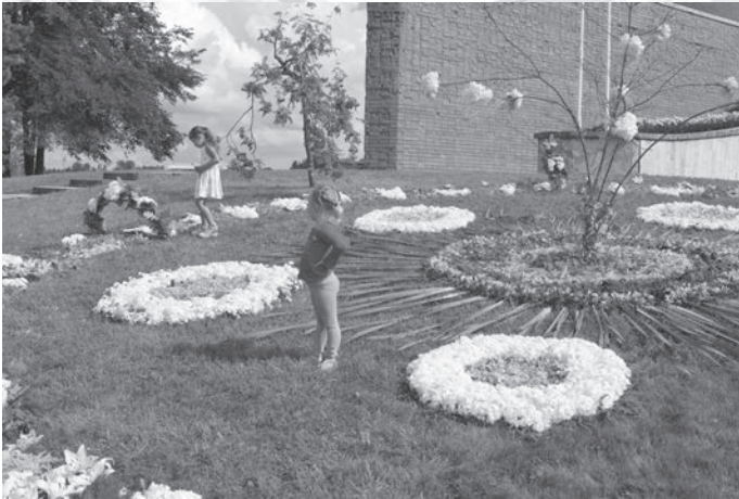
Madlienas diena 2014 ar Ziedu strūklaku