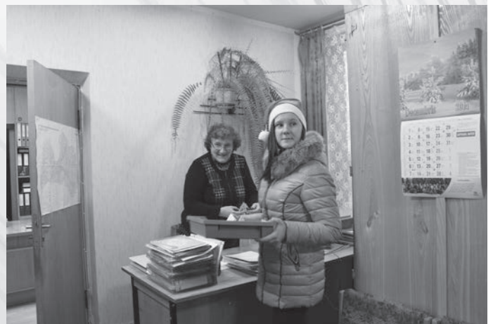
11.klases skolnieki/rūķi Labo darbu nedēļā ar pašdarinātām Ziemassvētku dāvaniņām iepiecinā pagastā strādājošos