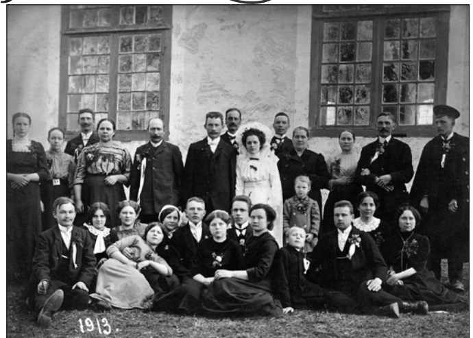
Kāzu foto pie Madlienas baznīcas 1913.gadā