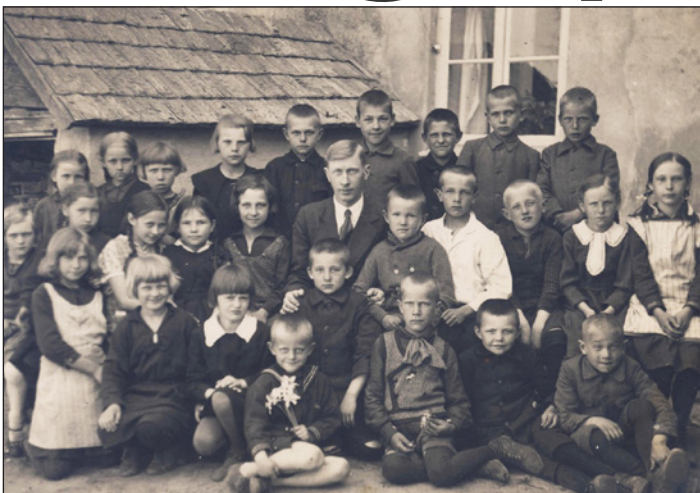
Madlienas pagasta skolēni 1933.gadā.