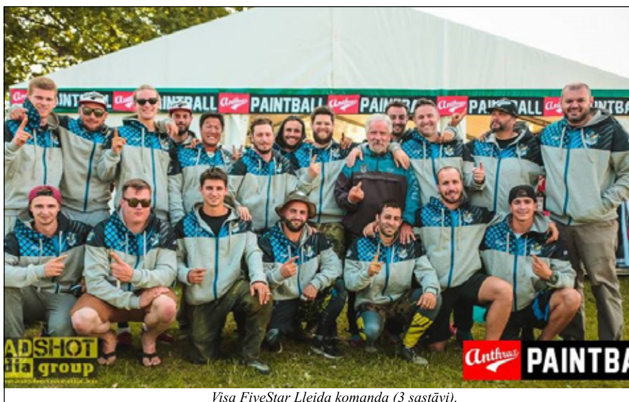
Visa FiveStar Lleida komanda (3 sastāvi).