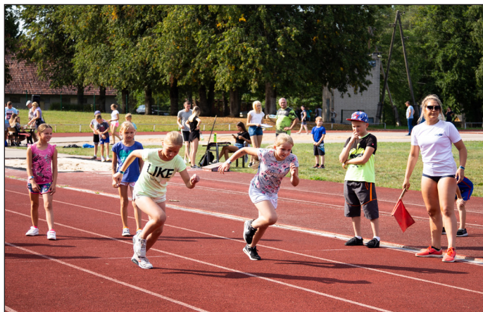
„Madlienas sporta svētki 2018” statistika

Viņš rezumē: „Prieks, ka Madlienas sporta svētki ir kļuvuši par gadskārtēju tradīciju daudziem pagasta iedzīvotājiem, kā arī sportisko aktivitāšu kalendārā iekļaujamu notikumu Ogres novada sportistiem. Paldies arī mūsu atbalstītājiem – Madlienas pagasta pārvaldei, veikalam „Ziedi un dāvanas”, veikalam „Kvants”, autoservisam „EM Rebild”, veikalam „Preces lauksaimniekiem”, veikalam „Husqvarna” Madlienā. Bez viņu palīdzības svētku norisi organizēt nebūtu bijis iespējams.”