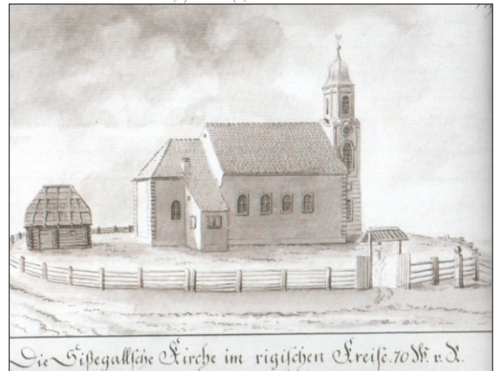
Die Sissegallische Kirche im rigischen Kreise. 70 St. v. J.