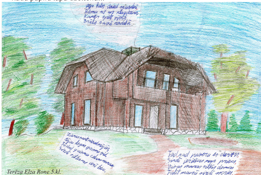
Terēza Elza Rone 5.kl.