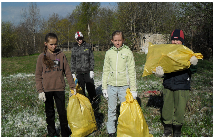
Šie skolēni noteikti nemetīs papīrus zemē un nepiesārņos Latvijas dabu.

Paldies pagasta pārvaldei par to, ka šajos finansiāli grūtajos laikos bija rasta iespēja pamieļot talcīniekus ar garšīgām pusdienām!-