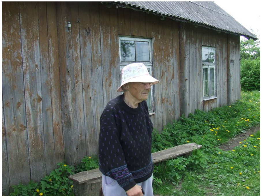
“Uzlikšu cepuri galvā kā dāmai!” pirms fotogrāfēšanās noteica jubilāre un itin veikli bija arī pagalmā.

Par savas dzīves gājumu viņa pastāstīs pati. Žēl tikai, ka uz papīra uzrakstītājā nevar izjust jauko latgalisko akcentu, kas bija saklausāms stāstītājas vēljoprojām mundrajā balsī.