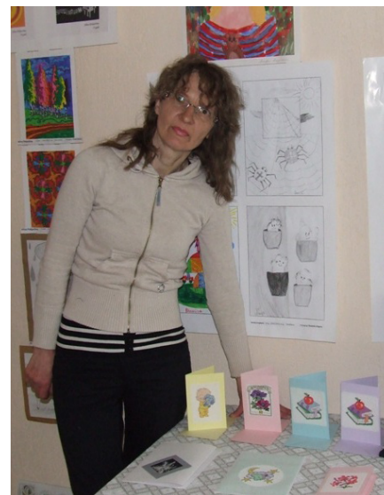
Māra un viņas darbiņi - apsveikuma kartiņas un grāmatzīmes ar izšuvumiem.