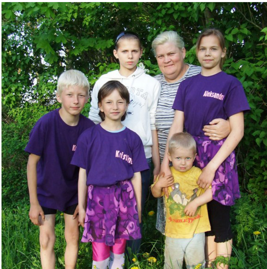
Cik labi, ka ir mammas drošais plecs, kam pieglauzties!