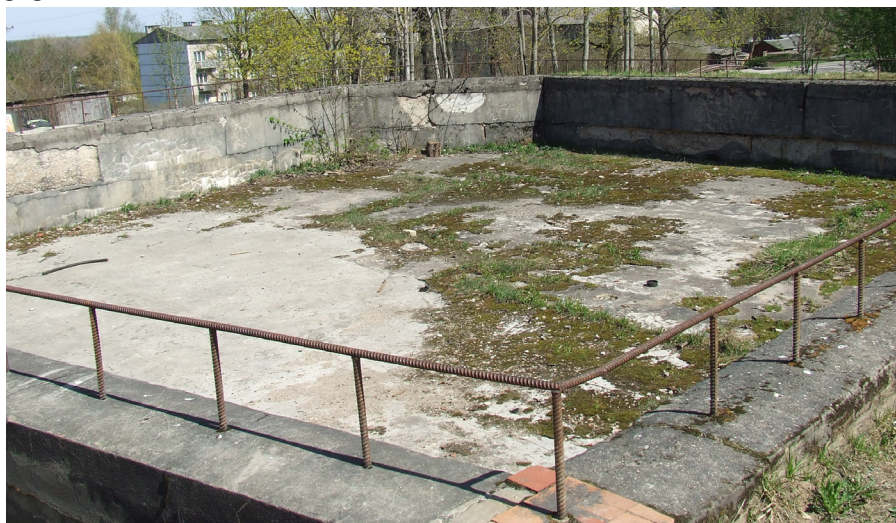
Tāds pašlaik izskatās lielais baseins pie Vējotnēm. Gaidīsim vasaras beigas, kad vecais baseins būs ieguvis citu izskatu un būs kļuvis par sporta un spēļu vietu.