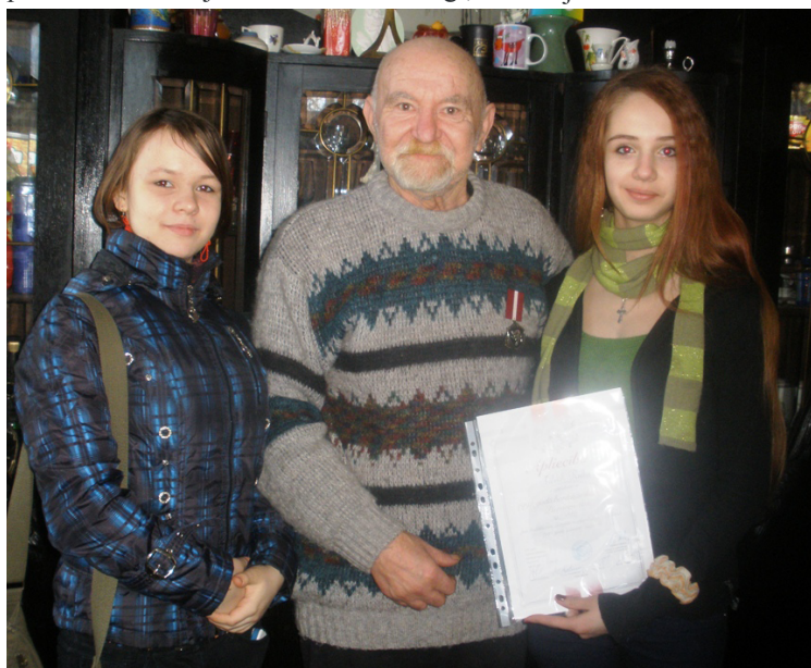
Projekta dalībnieces pie Talrida Ruļļa Kļāvos

„Aizbraucot uz lielo mītiņu, tur bija tik daudz cilvēku, cik mūžā nebija redzēti kopā. Bija ļoti liela vienotība un atsaucība. Bija cilvēki, kas izsniedza karstas zupas, tējas un citus ēdienus, neviens nepieprasīja naudu, viss bija par brīvu. Visi bija maksimāli atsaucīgi,