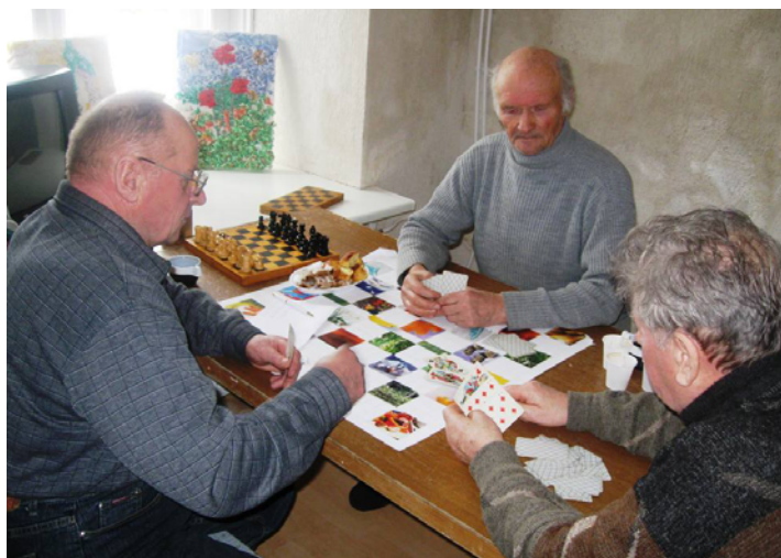
Nopietnus vīrus interesē vīru spēles - kārtis.

Gribu arī informēt ķeipeniešus, ka saskaņā ar Valsts ieņēmumu dienesta 2011. gada 23. februāra lēmumu biedrībai „Ķeipenes vides centrs” piešķirts sabiedriskā labuma organizācijas statuss.