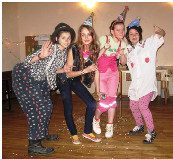
Biedrībā labi jūtas dažāda vecuma ķeipenieši - arī šīs atraktīvās meitenes.

Katru sestdienu no plkst. 11. 00 -12. 00 aerobika austrumu ritmos - jebkura