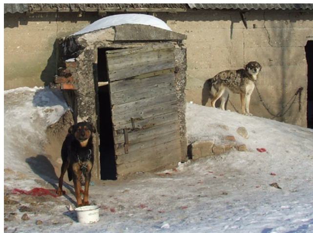
Skatoties uz šiem novārdzinātajiem, nosalušajiem, izbadējušies suņiem, saproti, kāpēc radies teiciens “suņa dzīve”.

Kad aizbraucām uz šīm mājām, pavērās bēdīgs skats - divi suņi (suņu meitenes), bez kaklasiksniņiem piesieti īsās metāla ķēdēs, novājināti, novārdzināti, nosaluši, jo viņiem jāguļ ārā uz sasalušas zemes, trešais suns (arī suņu meitene) piesiets šķūnītī, bet tikpat šausmīgos apstākļos, piedevām vēl tam nupat piedzimušī kucēni.