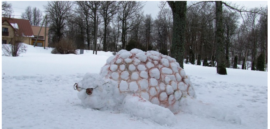
Sniega bruņurupučis - pati iespaidīgākā pie skolas tapusī sniega skulptūra.