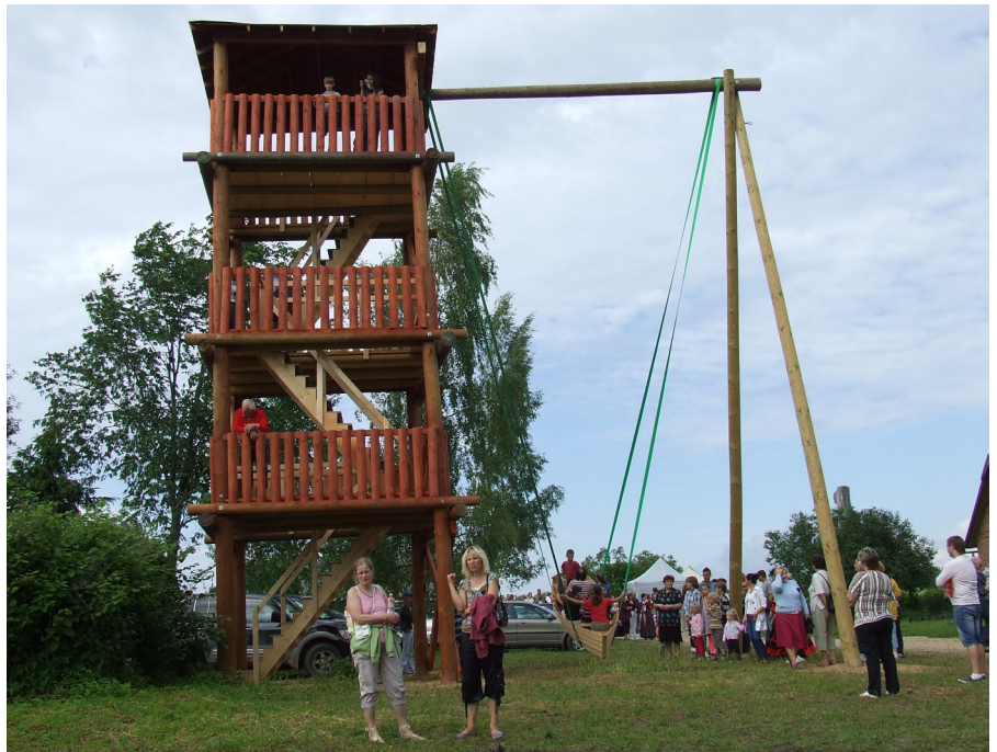
Milžu šūpoles (11 metrus augstas) un skatu tornis tām blakus Šūpoļu parka atklāšanas dienā š.g. 15. jūnijā. Tie, kas Zušos nebija parka atklāšanas dienā, varat braukt un izšūpoties pēc sirds patikas.