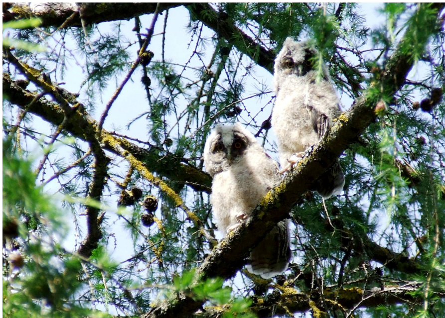
Smukie pūcēni tup lapeglē pie D. Krievānes ģimenes ārsta prakses