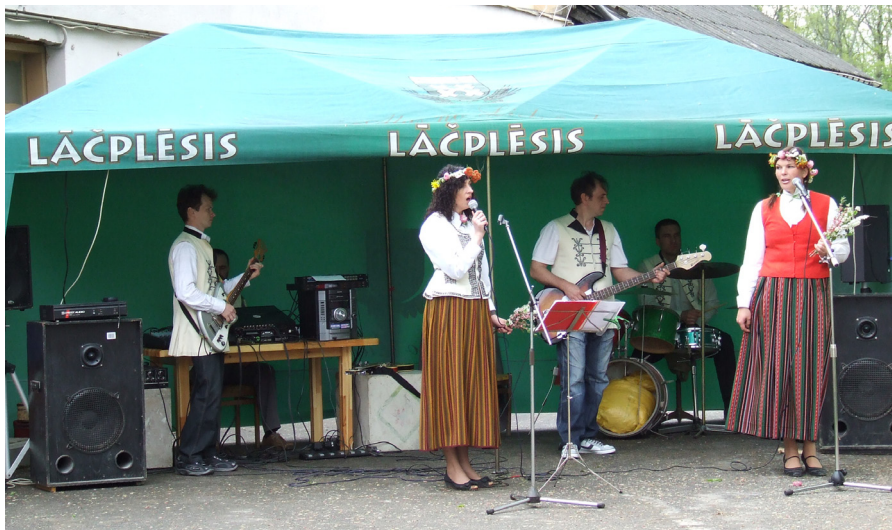
Vokāli instrumentālajam ansamblim “Aizmirstā jaka” uzstāšanās Ķeipenes gadatirgus koncertā bija pirmā parādīšanās publikai.