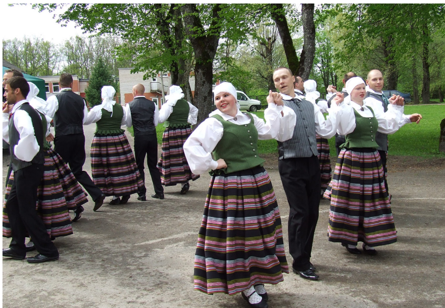
Pavasara gadatirgū uzstājas vidējās paaudzes deju kolektīvs “Dandzis”.