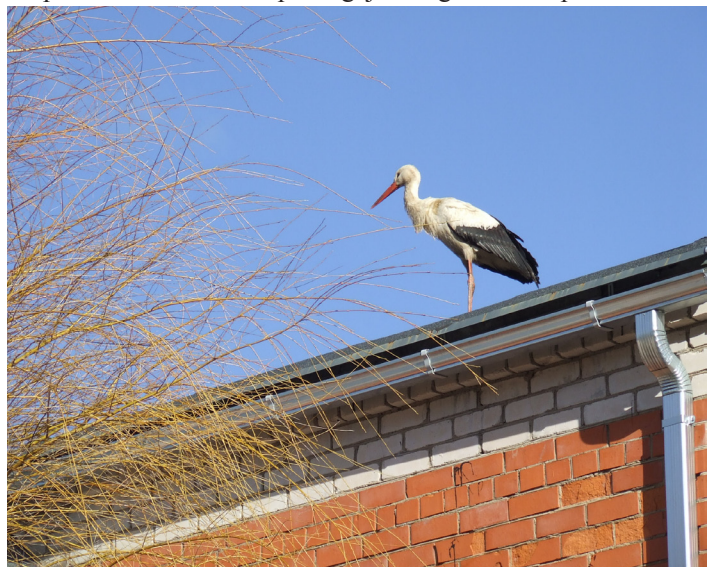
Cirkulis Ķeipenes ciema centrā labprāt pastaigājās pa māju jumtiem. Kā Karlsons.

Vēlāk uzzināju, ka stārķis Ķeipenes centrā parādījies jau trešdien: pastaigājies pa skolas sporta laukumu, sadraudzējies ar skolas bērniem (vienai meitenei gan centies ieknābt) un nav atraidījis piedāvāto cienastu. Tad aizlidojis. Viens vecs vīrs staigājis pa sporta laukumu ar svaigas gaļas gabaliņiem rokās, gribēdams stārķi uzciņāt, bet velti – stārķis jau bijis prom.