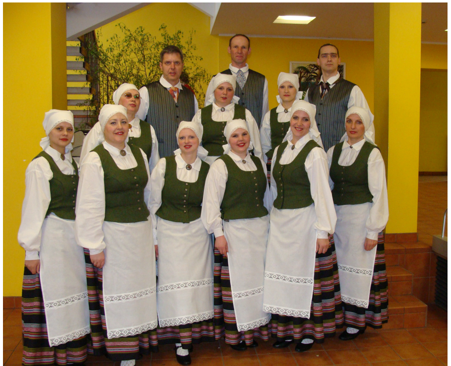
Vidējās paaudzes deju kolektīva “Dandzis” dalībnieki (gan ne visi) jaunajos tērpos un gandarīti par veiksmīgo uzstāšanos Ogres aprīņa deju skatē.

Paldies visiem dejojājiem par izturību, ieguldīto laiku, par sapratni un