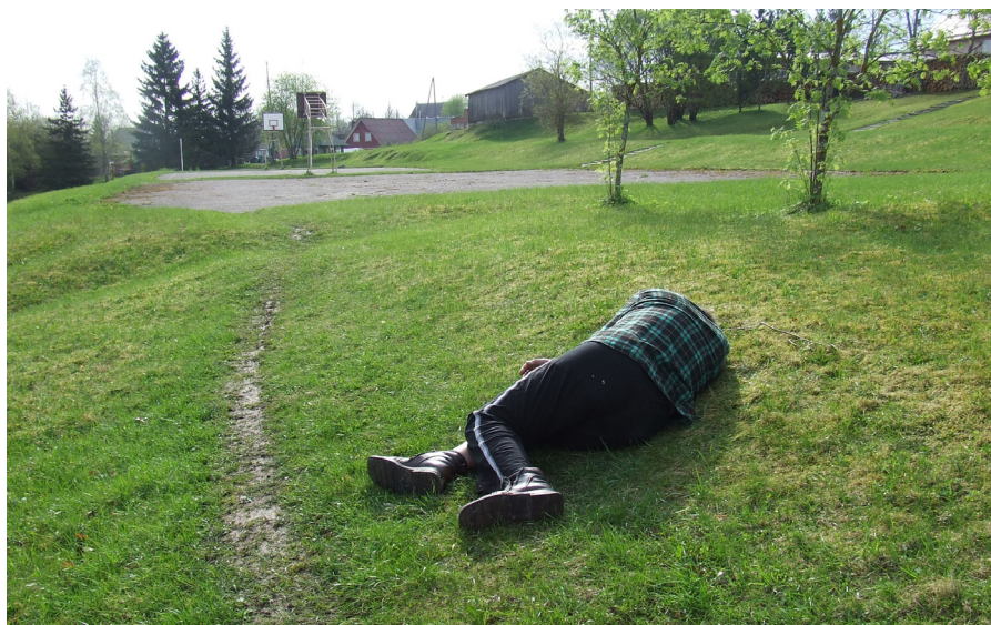
No malas šādi “kritušie” ķeipenieši diezin ko pievilcīgi neizskatās....

Bibliotēka būs slēgta š.g. 2. februārī, 10. februārī un 24. februārī.