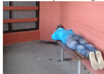
“Sagurušais” Ķeipenes viesis.