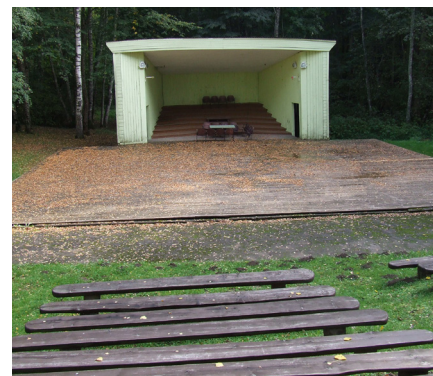
Taurupes brīvdabas estrāde kalpo jau vairāk nekā 40 gadus.