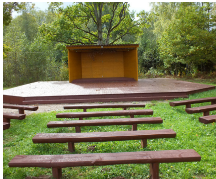
Mazozolu brīvdabas estrāde.

Estrāde atrodas skaistā, ozolu ieskaudā vietā Līčupes krastā. Mazozoliešiem tātad ir vieta, kur vasarās rīkot pasākumus vietējiem iedzīvotājiem. Bet