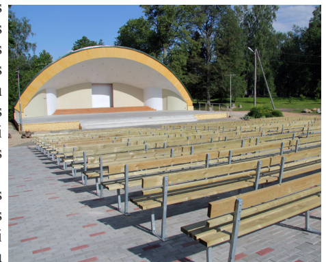
Suntažu brīvdabas estrāde.

Iniciatīva par estrādes renovāciju nākusī no Suntažu kultūras nama direktores Dzidras Sproģes puses, kura nolēmusi pieteikties biedrības „Zied zeme” izsludinātajā projektu konkursā, iesniedzot projektu par Suntažu estrādes renovāciju.