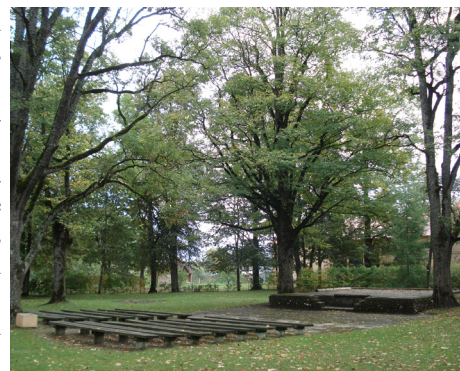
Lauberes brīvdabas estrāde.

Lauberes brīvdabas estrāde atrodas pašā Lauberes ciema centrā, esot sen būvēta, un tajā notiekot vien Jāņu dienas