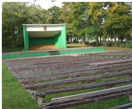
Madlienas brīvdabas estrāde gaida savu atjaunotni.

Madlienas ciems pārejo ciemu vidū un sovhozs „Madliena” pārejo saimniecību vidū padomju laiku preses izdevumos vienmēr ir izcelti un cildināti kā paraugi citiem. I. Ziedonis pat uzrakstījis slavinošu grāmatu par Madlienu „Tik un tā”. Kaut gan, pavisāmērā pāršķirstot šo grāmatu par Madlienu, informāciju par Madlienas brīvdabas estrādi nepamanīju, tomēr droši vien, ka sovhoza ziedu laikos Madlienas estrāde bija augstā līmenī un vizuāli