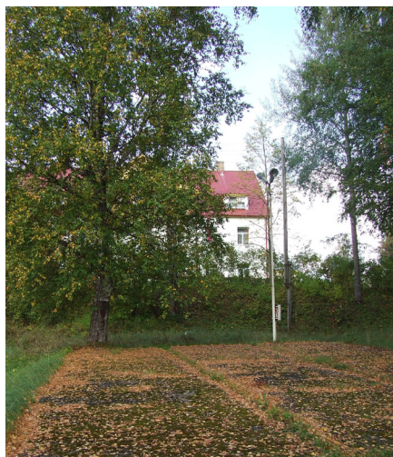
Vecā Meņģeles estrādes vieta, kurā, pēc vietējo teiktā, pasākumi vairs nenotiek.

Meņģeles pagasta Meņģeles ciema centrā sastaptā vietējā iedzīvotāja atbildēja, ka Meņģelē brīvdabas estrādes,