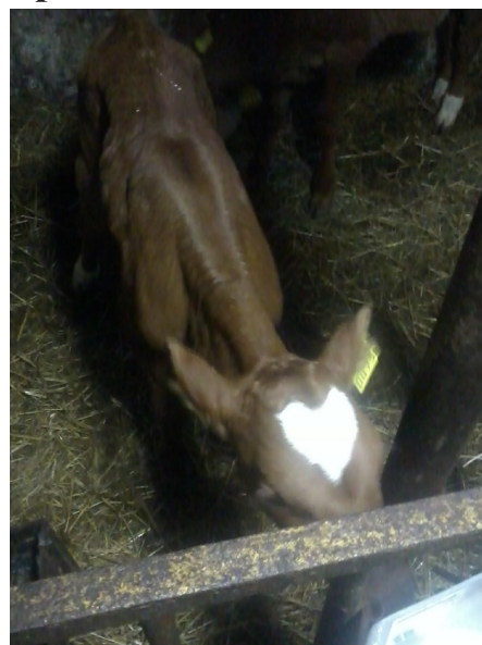
Telīte Nīta savā pirmajā dzīves dienā.

Ķeipenes bibliotēkas vadītāja Ivita Pumpure informē, ka no š.g. 9. septembra Ķeipenes bibliotēka apmeklētājiem atvērta pirmdienās, otrdienās, trešdienās, ceturtdienās un piektdienās no