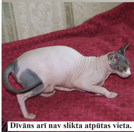
Dīvāns arī nav sliktā atpūtas vieta.

piecos ir klāt pie manis, met ar ķepām, ņaud. Nekas cits neatliek, kā celties un kaķi pabarot.