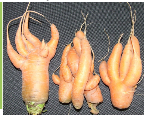
Ķeburaini burkāni visos laikos topā.