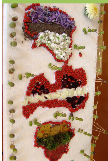
5. klases skolēnu veltījums Baltijas ceļa atcerei. Mūsu Latvija - viskrāšņākā.