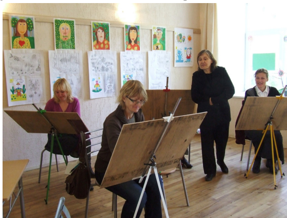
Mākslas nodarbība Ķeipenes vides centrā.

Arī citas interešu grupas aicinātas darboties biedrības telpās.