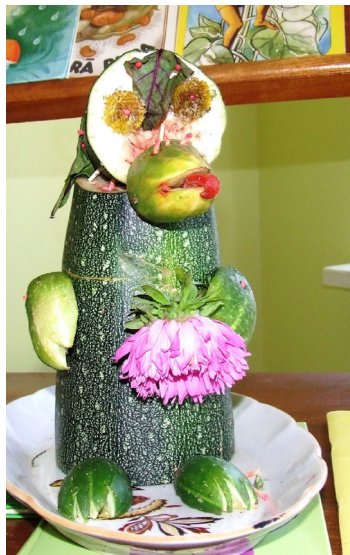
Šādu zvēru ceļā satiekot, es jau nu noteikti sabītos.