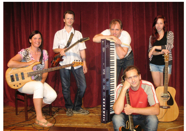
Ansamblis "Impro Band"

9.martā „Sonore” piedalījās vokālo ansambļu skatē. Šogad skate bija koncerta veidā, kolektīvi netika vērtēti, bet žūrija bija un visiem kolektīviem koncerta izskaņā izteica kopīgo iespaidu par dzirdēto un redzēto.