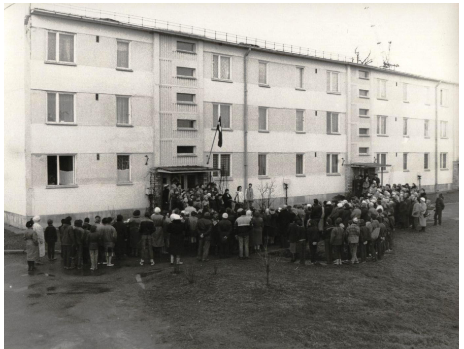
Atmodas laiks Keīpenē. Latvijas karoga iesvētīšana pie toreizējās Keīpenes ciema izpildkomitejas, kas atradās daudzdzīvokļu mājā “Akācijas”. Tas varētu būt 1989. vai 1990. gada pavasarī - uzrunātie notikuma aculiecinieki diemžēl neatceras precīzu datumu.

Par bieži pausto domu, ka mēs nespējam domāt kā saimnieki, jo esam kalpu tauta,