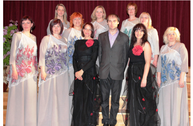
Sieviešu vokālais ansamblis "Sonore"

Nu jau četrus gadus Ķeipenē deju arī vidējā paaudze. Vidējās paaudzes deju kolektīvs „Dandzis” pa šiem gadiem no bailīga, nedroša neglītā pīlēna izaudzis par gulbi. Skatē iegūta augstākā pakāpe. Esam sasnieguši labu līmeni, un pats grūtākais ir šo līmeni noturēt.