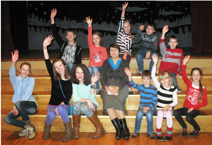
Teātra studija "Ķepa"