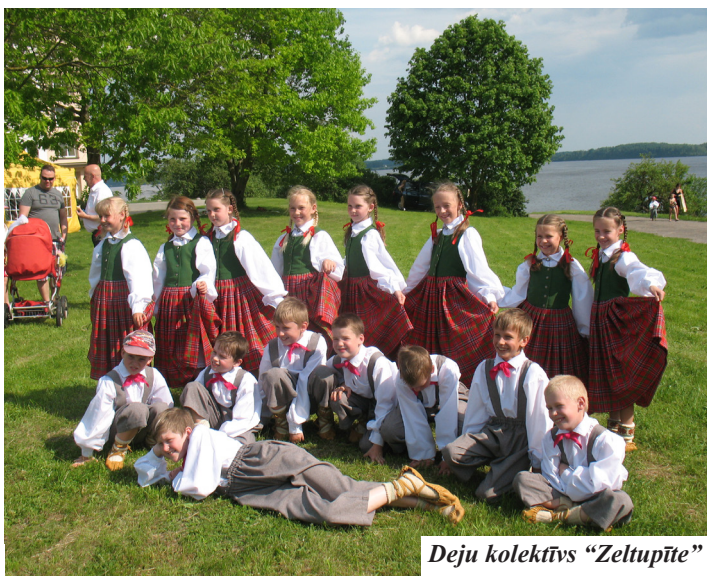
Deju kolektīvs „Zeltupīte”