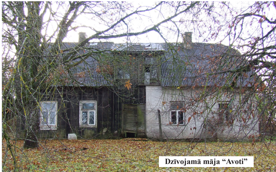
Dzīvojamā māja „Avoti”

Īpašuma pārdošanas sākumcena - EUR 7460,00. Izsoles solis - EUR 100,00.