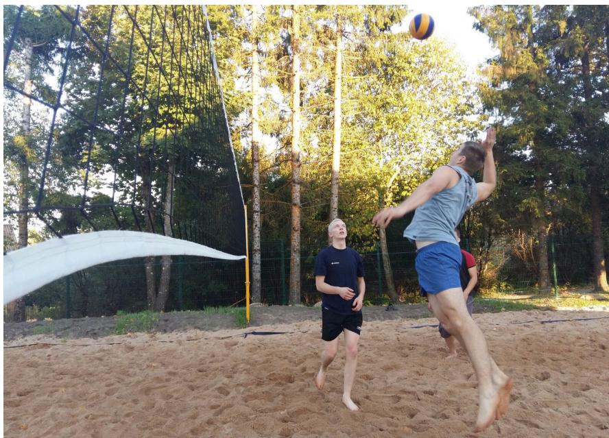
Ķeipenes jaunieši šogad jau paguva iemēģināt atjaunoto volejbola laukumu.