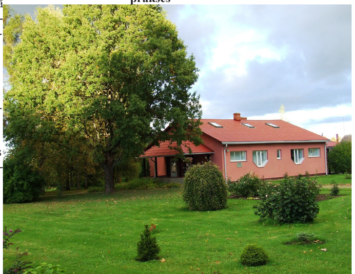
Daces Krievānes ģimenes ārsta prakses ēka un tās apkārtnē vienmēr priecē ar sakoptību, ziediem un gaumīgām krāsām.