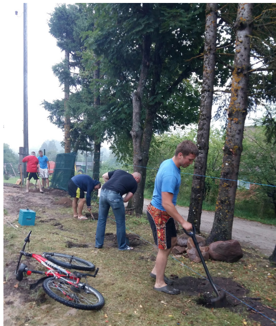
Darba procesā iesaistījās ļoti daudz jauniešu.

Lai laukuma segums būtu irdenāks un kvalitatīvāks, iegādājāmies 10 m 3 skaloto smilti, ar kuru veidojām laukuma virskārtu 15 cm biežumā. Vēl pārkrāsojām vecos tīkla stabus. Nopirkām divas jaunas bumbas, tīklu un laukuma līnijas. Šī projekta finansējums 1000 euro tika iztērēti pilnībā.