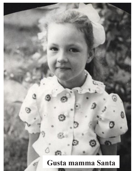
Gusta mamma Santa