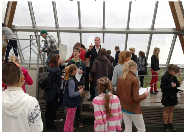
Ķeipenes pamatskolas skolēni ar interesi vēro Jelgavas Sv. Trīsvienības baznīcas torņa ekspozīciju

Apskatot skolēnu atsaucsmes pēc ekskursijas, kas tika apkopotas pašvērtējuma veidā, jāsecina, ka šāda ekskursiju tradīcija, kurā piedalās teju visa skola, ir jāturpina. Skolēni norādīja, ka labāk iepazīši skolēnus no citām klasēm, labāk apguvuši konkrēto vēstures posmu un labprāt vēlreiz brauktu šī paša maršruta ekskursijā. Skolotājiem nav lielāka prieka, redzot skolēnus smaidīgus, apmierinātus, nogurušus pēc brauciena, nemaz nerunājot