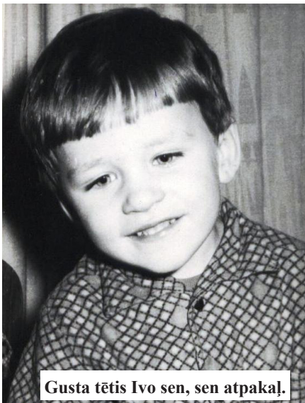
Gusta tētis Ivo sen, sen atpakaļ.

Santa. - Ir viens bēdīgs notikums. Biju skolas dežurante, skrēju pakal nepaklausīgiem skolēniem, lai aizrādītu par viņu uzvedību, un 2. stāvā nejauši aizķēru un sasitu dārgu vāzi. Vēl tagad atceros tās cenu - 50 rubļi. Mammu izsauca uz skolu, un man bija nepatīkšanas.-