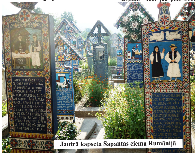
Jautrā kapsēta Sapantas ciemā Rumānijā

Jauni vīrieši ir paplatās baltās biksēs,