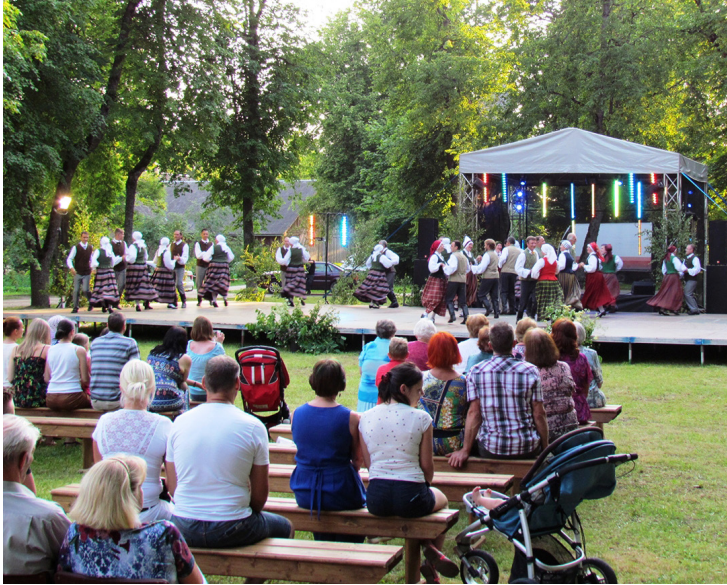
“Sadancis 2015” notika uz nomātas pārvietojamās skatuves.