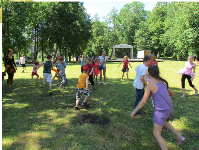
Bērni izklaidējas svētku jampadraci.

Vakarpusē pļaviņā pie Tautas nama aizsākās tautas deju kolektīvu «SADANCIS 2015». Šim pasākumam par godu speciāli bija uzbūvēta apskatnā un izgaismota