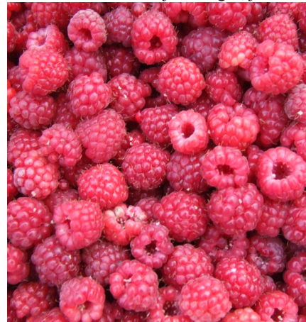
Turpinājums 6. lpp.

Ogu laikā par ēšanu un ēst gatavošanu neiznāk laika domāt - jālasa ogas, jāved arī