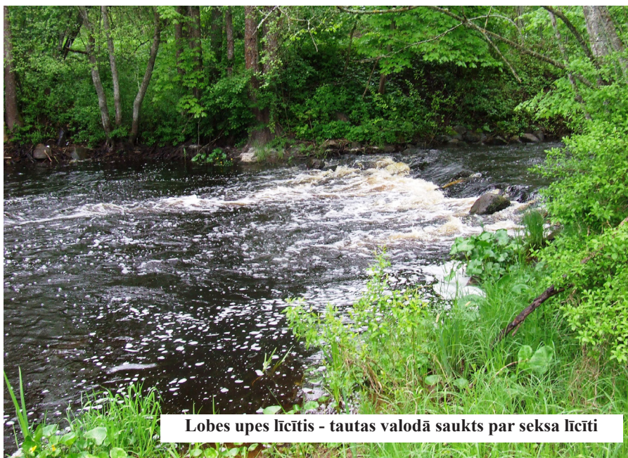
Lobes upes līcītis - tautas valodā saukts par seksa līcīti

Nupat ir runas par to, ka Latvijā tuvākajos gados varētu būt jāizmitina ap 5000 bēgļu. Varbūt izdomās tos sūtīt uz pustukšajiem