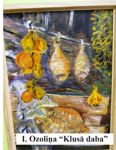
I. Ozoliņa "Klusā daba"