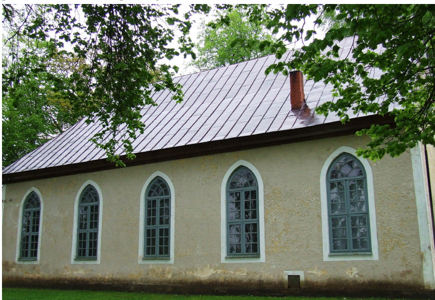
Krapes evaņģēliski - luteriskā baznīca

Kādreizējais Krapes pagasta darbīguma un pārticības simbols – Krapes pienotava stāv pamesta, vienuļa, klusa un bēdīga. Garum garā pienotavas ēka piederot Rīgas piena kombinātam, kas nevienam ēku nevēloties iznomāt. Pienotava beigusī darboties 2004. gadā.