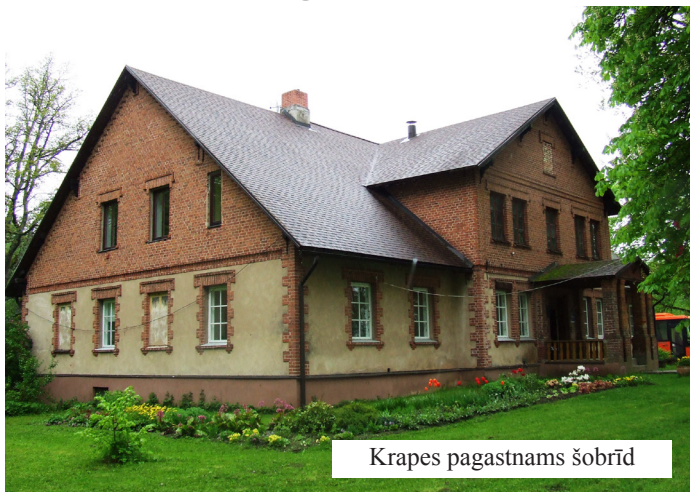
Krapes pagastnams šobrīd

-Tempora mutatur, et nos mutatur in illis. /Laiki mainās, un līdz arī tiem mēs./ – vēsta latīņu teiciens. Šis teiciens īsti nav attiecināms uz Krapes pagastu, kur daudz kas no veco laiku laiku godības ir