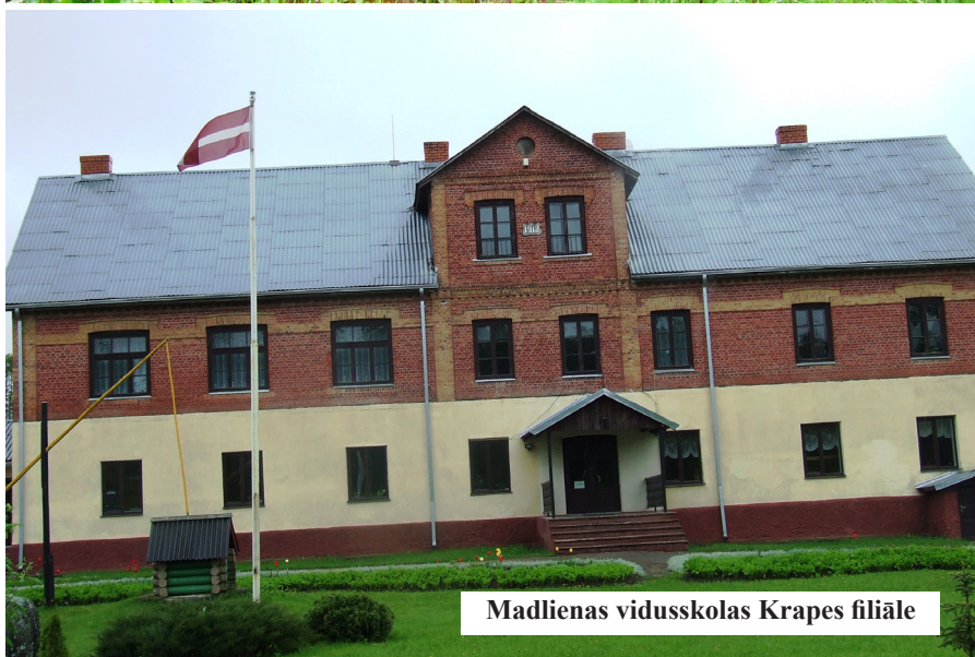
Madlienas vidusskolas Krapes filiāle

laukiem? Bet tad tie vairs nebūs latviskie lauki. Bet tieši laukos un skaistajā dabā ir mūsu tautas dvēsele, stiprums un spēks. Savu rakstu nobeigšu ar tautasdziesmu, kas pierakstīta Krapē. Lai tā izskan kā