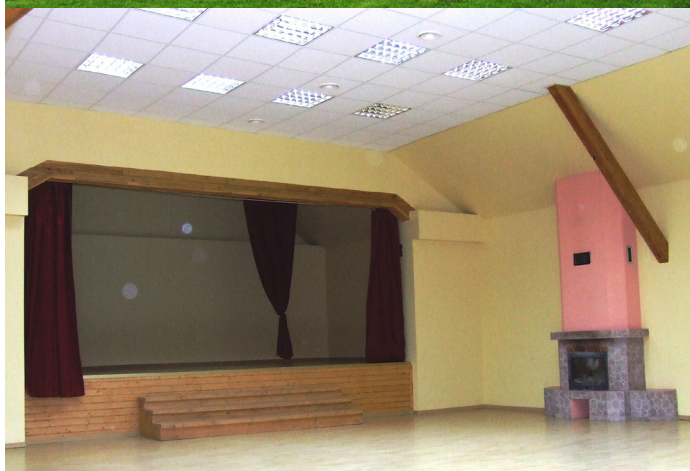
Krapes pagastnama 2. stāvā atrodas tautas nams, bet 1. stāvā - bibliotēka. Kā redzat - tautas nama telpas ir renovētas, mūsdienīgas, gaišas, patīkamas.