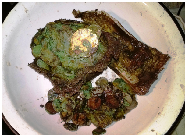
Vērtīgais atradums – monētas, ielītas drāniņā un bērza tāsi.