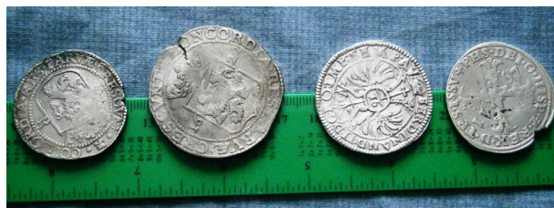
Pāris eksemplāru no monētu kolekcijas.