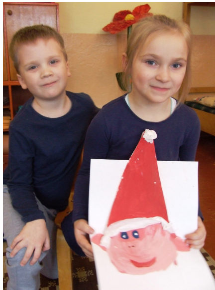
Raiens un Kitija Līva

Uz svētkiem mēs visi mājās cepsim bulciņas. Māsa neceps, jo viņai ir tikai viens gads. Es mammai un tētim uz svētkiem uzdāvināšu zīmējumus.-