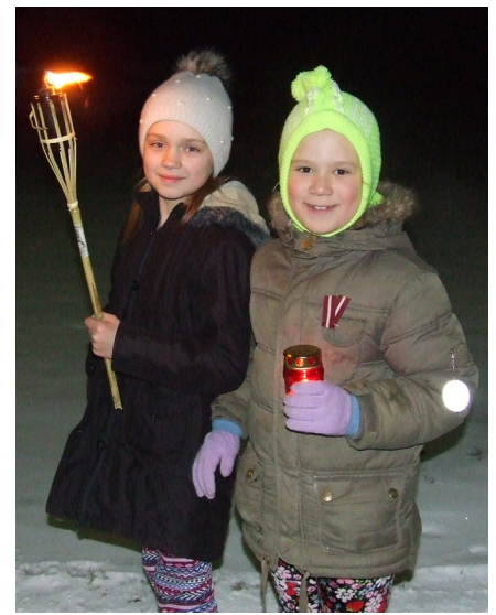
Aug Latvijas jaunās patriotes