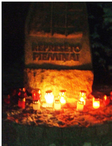
Represēto piemiņas akmens, sveču liesmiņu izgaismots