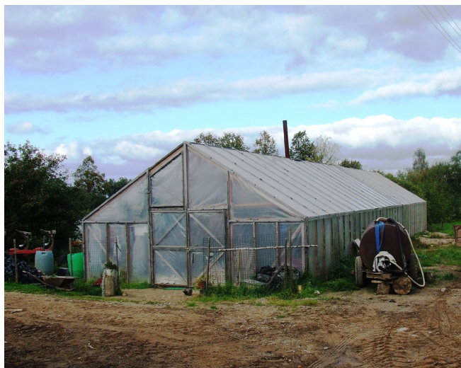
Sniedze pati nebija pierunājama nofotogrāfēties, toties atļāva nofotogrāfēt savu siltumnīcu.

- Arī īpašu knifiņu man nav. Vienkārši pareizi un laikā viss siltumnīcā jāizdara, darāmos darbus nedrīkst nokavēt, tad arī būs laba raža. Protams, nozīme ir arī tam, cik kvalitatīvu plēvi vari atļauties uzlikt siltumnīcai – ja plēve nav tik kvalitatīva, tad ūdens kondensāts sakrājas un pil uz augiem; arī tam, kāds ir siltumnīcas augstums u.c. faktoriem.-