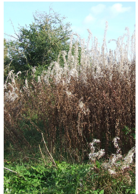
Garas ugunspuķes saaugušas gandrīz pašā pagalmā. Kas gan tās nopļaus, ja gandrīz visi mājas iemītnieki ir veci un slimi?