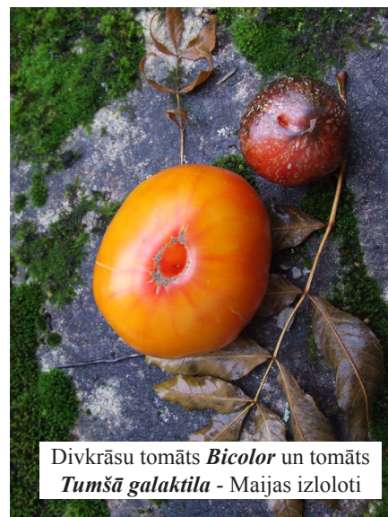
Divkrāsu tomāts Bicolor un tomāts Tumšā galaktika - Maijas izloloti