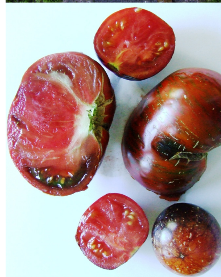
Svītrainā šokolāde (lielākais) un Tumšā galaktika - arī no Maijas siltumnīcas

- Tomāts ir kā niķīgs puišelis, kuru audzinot vajadzīga stingra mammas (audzētāja) roka un vēriņa acs, lai tas izaugtu par nopietnu vīru. Ja nopietni - šīs ogas sastāvā ir ļoti daudz veselībai nepieciešamu vielu, kas cīnās pat ar vēzi izraisošām šūnām.