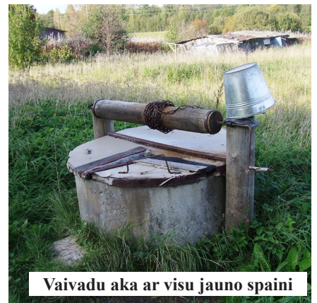
Vaivadu aka ar visu jauno spaini