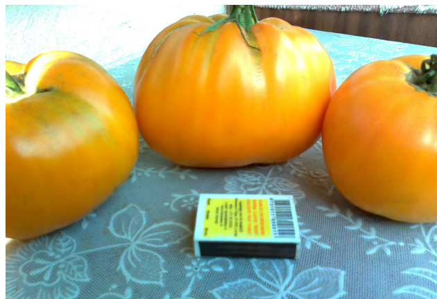
Vingras iecienītās šķirnes Dina tomāti. Lielākais sver 898 gramus.

Tomātus pārsvarā apēdam svaigā veidā. Esmu tomātus arī salikusi burciņās - man ir tomāti ar svaigiem gurķiem un sīpoliem