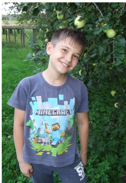
Dzintars - nu jau atkal Ķeipenes pamatskolas skolnieks