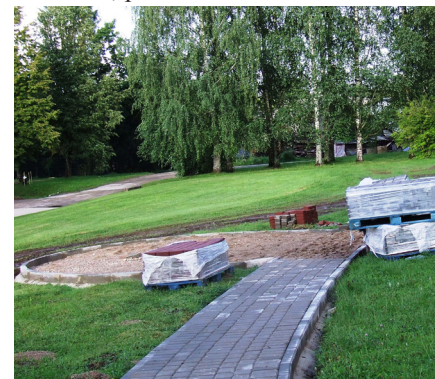
Pie Ķeipenes pamatskolas top reprezentabla vieta Latvijas karogam

Nāksim ar labām, radošām idejām, kopīgi strādāsim pie šo ideju īstenošanas - tikai tā mūsu visu Ķeipene kļūs skaistāka, patīkamāka un interesantāka.