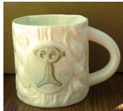
Fabrikā tapusi krūzīte ar adījuma rakstu un pūces saktu

Ž. Ž. Ruso ietekmē R.Kaudzīte sarakstījis apmēram 900 aforismu. Daži no R.Kaudzītes aforismiem: „Labi paēst, labi apģērbties, kurš to labprāt tā negrib? Bet arīdzan labi strādāt, vai visi labprāt to grib?”; „Apsolīties mīlēt līdz nāvei ir ļoti viegli; gribēt līdz nāvei mīlēt – ļoti grūti; mīlēt līdz nāvei – sametas daudzreiz plāna dūša, ja nāve tālu.”; „Tumšai naktij gaišas zvaigznes.”; „Jo mazāk kāds runā, jo vairāk dzird tā vārdus.”