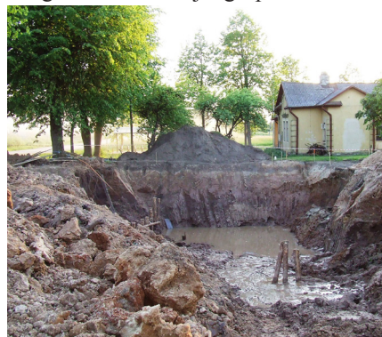
Rakšanas darbi pie bijušās Ķeipenes dzelzceļa stacijas