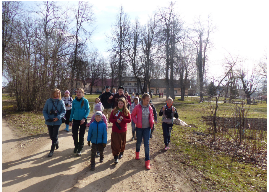
Apbruņojušies tālskatiem, putnu draugi dodas dabā