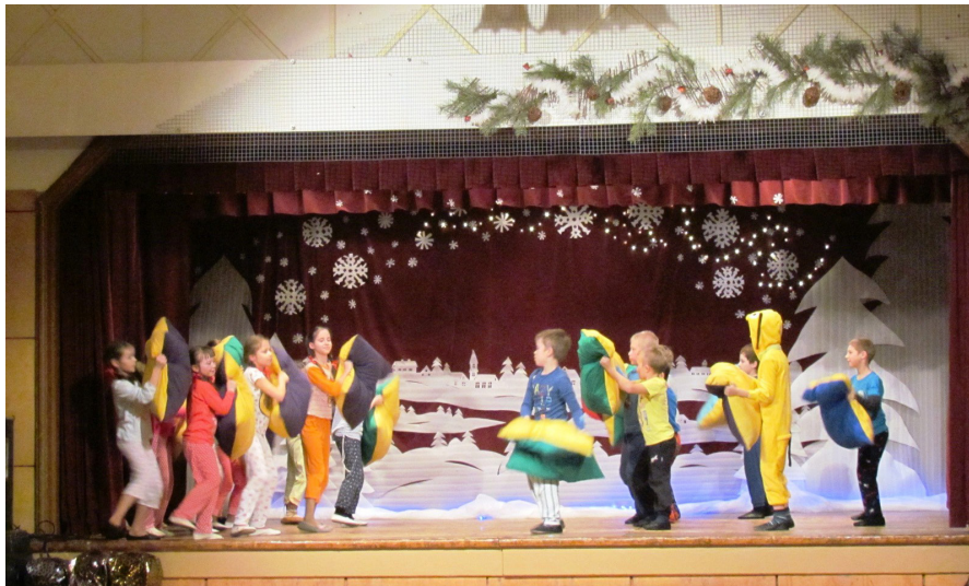
Mirkļis no bērnu tautas deju kolektīvu sadanca „Deju spēles”

Pēteris Tropiņš. - Ģimenes viesību sindroms – tādas izjūtas mani pārņēma, aizejot uz bērnu deju sadanci tautas namā. Ieeju klubā. Durvis uz zāli plaši atvērtas un redzu, ka galdi klāti ar ēdieniem, dzērieniem. Bērni, mammas, papas, aukles pilna zāle. Savējie. Vai tad slēgtais vakars, ko? Man nekā līdzīgs nebija, ko likt galda. Gāju projām. Viss...-